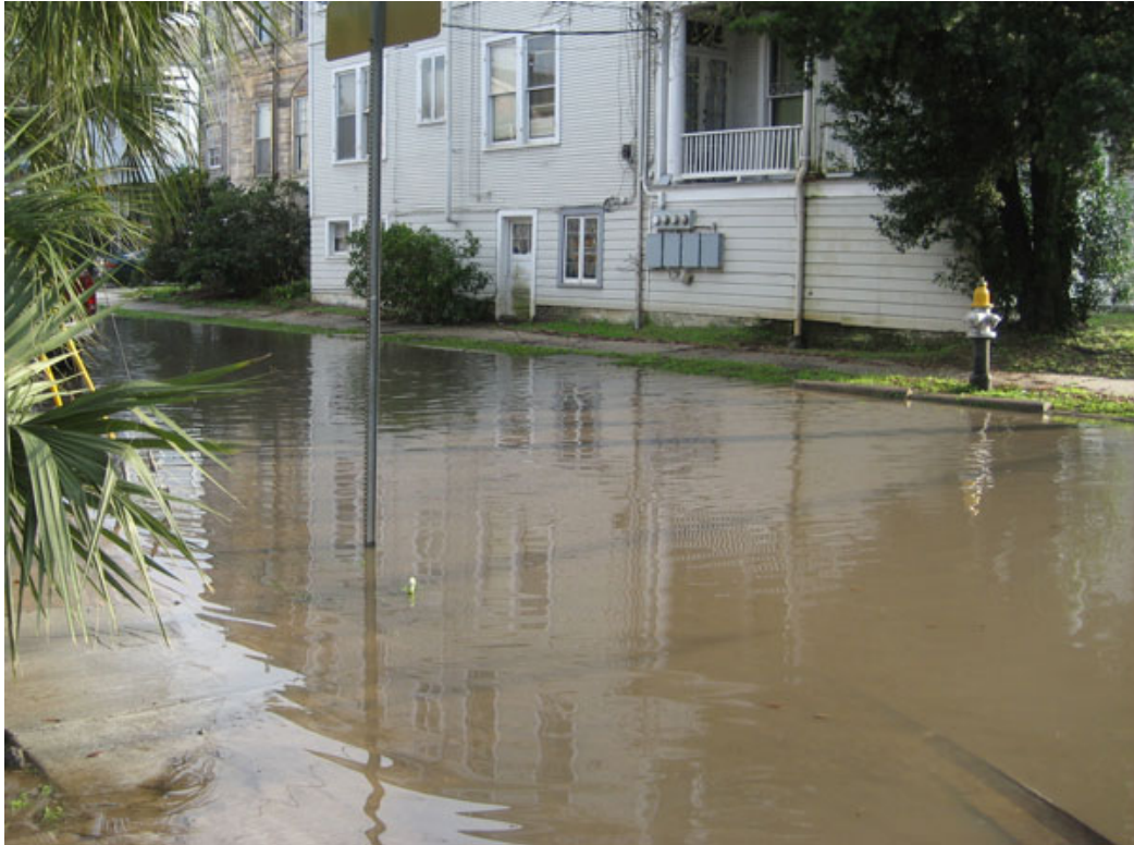
Fig. 2 – Mapple Street, inondée en deux heures après une pluie intensive (plus de 5 cm/h).

les parties les plus anciennes du système ayant une capacité moindre. Nous nous référons à ces nombreuses inondations dont sont victimes toute l'année certains microreliefs de la ville (voir Figure 2).