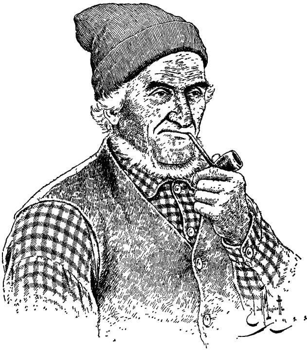
Gravure de Edmond-J. Massicotte pour « Nos Canadiens d'autrefois » (Montréal, Granger, 1923).