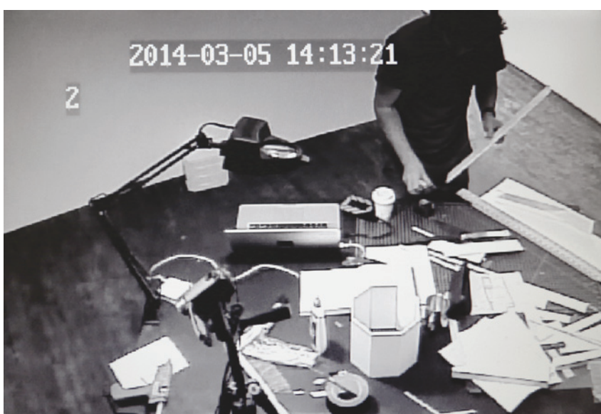
Sébastien Cliche, Self Control Room , 2014, image tirée des enregistrements de surveillance.