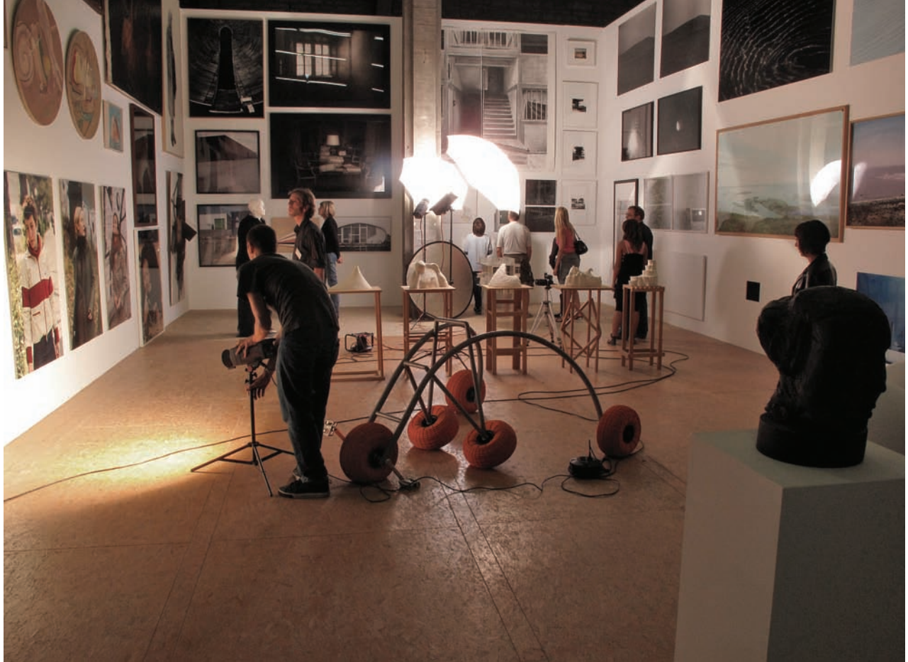
Charles Fréger, Grande Galerie , photo pour le catalogue de l'exposition '90'.

veut que l'œuvre soit décontextualisée, isolée, sacralisée, hyperesthétisée, au moyen d'une hauteur standard, d'une distance entre les œuvres, d'un éclairage, etc. Il y a là une tentative de mise en critique du dispositif, qui renvoie à une réflexion plus générale sur une société dans laquelle la présentation est plus importante que l'objet en lui-même. Pourquoi présente-t-on les choses comme ça et pas autrement ? Y a-t-il un au-delà de la structure ?