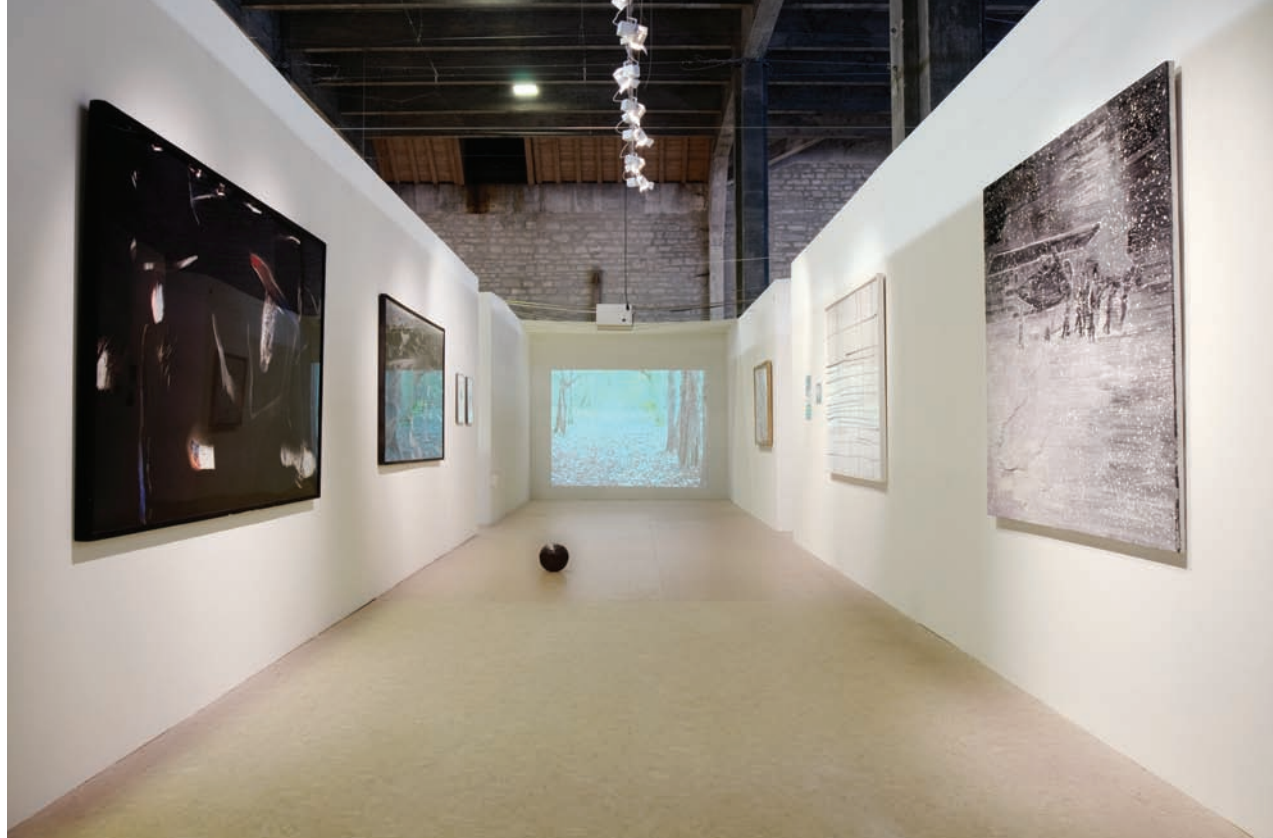
Aurélien Mole, exposition 90', galerie Sans Titre.

fictionnel du display . Dans la « galerie des archives », la direction des néons a été changée, au lieu d'une grande bande traversant la galerie, ils ont été placés perpendiculairement comme dans des bureaux.