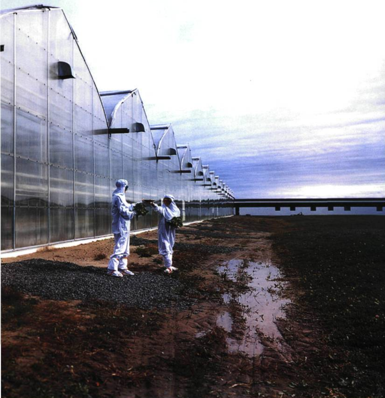
Ève K. Tremblay, Hors serres . Photographie.

laser , deux personnages, toujours de blanc vêtus, la tête recouverte d'un couvre-chef de même couleur, semblent mesurer le degré d'humidité de la terre où s'enracine une salade. Nous sommes là bien loin de la référence futurologique que nous laissait espérer pareille formulation. De même, Les pleureuses montrent deux silhouettes lointaines, toujours blanchâtres, penchées sur les tâches à accomplir dans une serre au sol piqueté des feuilles vertes d'un légume encore immature. Bref, il y a de l'effet dramatique dans ces titres, un effet qui vient forcer un sens et conditionner notre lecture de ce qui est montré. Ces réminiscences, aux