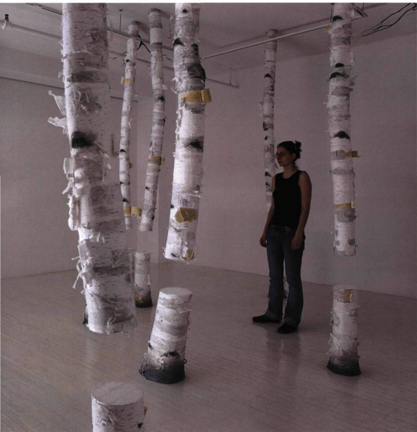
Maude Léonard-Contant, Surtout ne prends pas froid (détail) , 2007. Installation. Circa, Montréal.

pas froid . Elle a recréé un « extrait » de forêt où des arbres réunis, qu'on croirait véritables, jouent un rôle et un leurre qui tiennent, en fait, de l'incongruité ou de la tragédie.