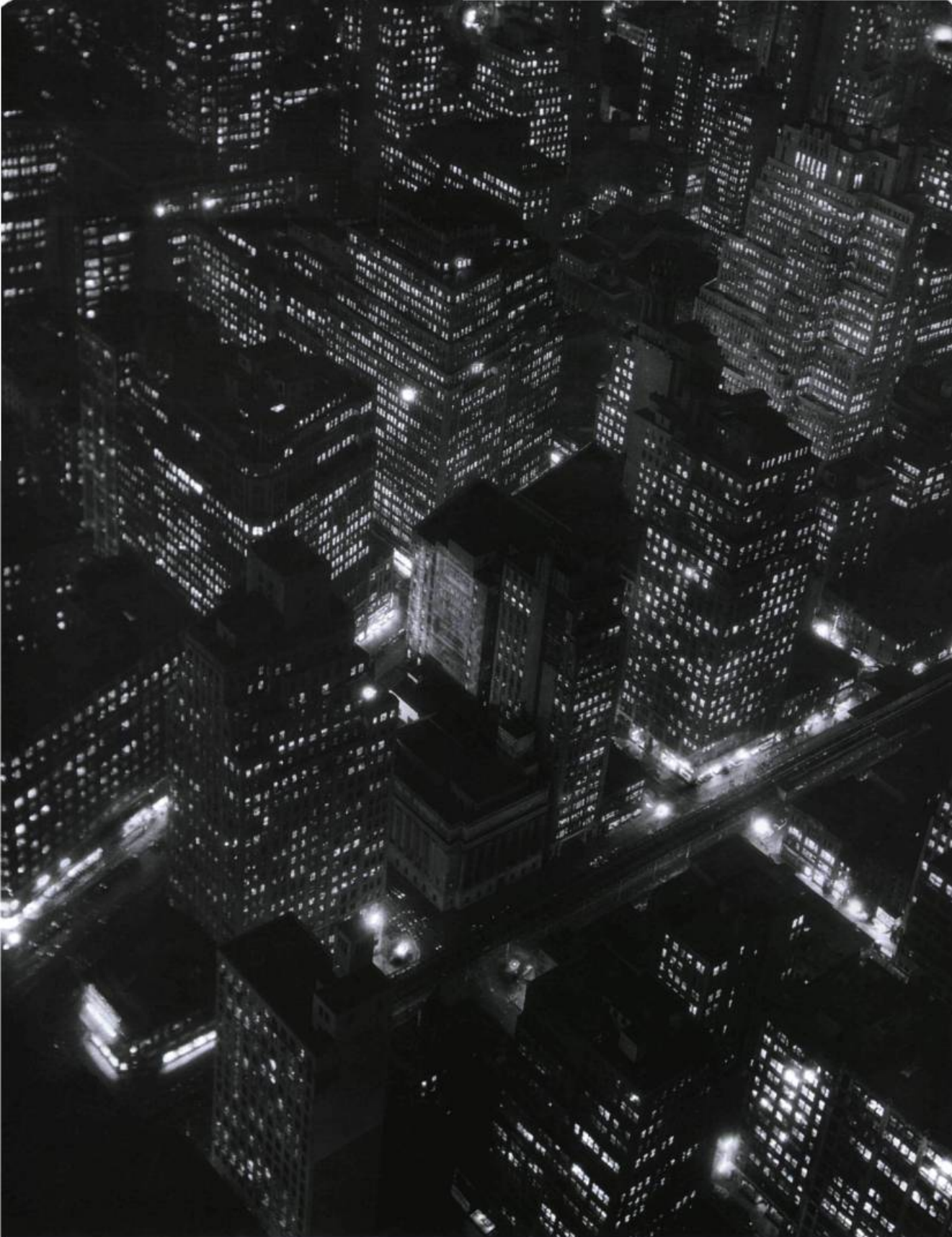
New York de nuit , 1932. Collection du Centre Canadien d'Architecture, Montréal. Berenice Abbott; 33,6 x 27 cm.

notre sens de la localisation change à mesure que les sons qui nous entourent deviennent ceux de Paris en 1999, alors que nous émergeons dans une salle entièrement consacrée aux différentes modalités sensorielles de créatures avec lesquelles nous partageons nos villes : chiens, rats, mouches, pigeons, chats. Ces créatures sont également citoyennes de la ville, ce que nous comprenons en voyant comment elles arrivent à connaître la ville d'une manière très différente.