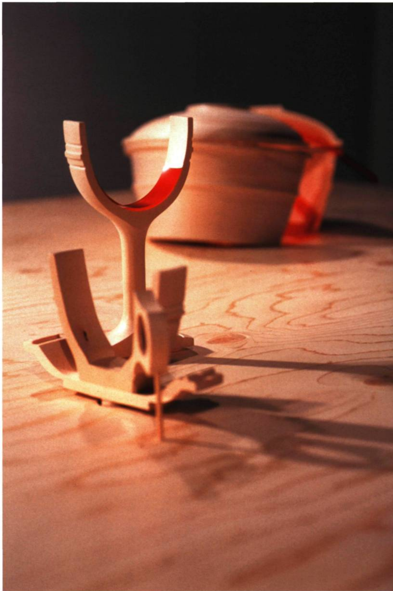
Marion Labrecque, Les témoins . Sculpture. Galerie de l'UQÀM, Montréal.