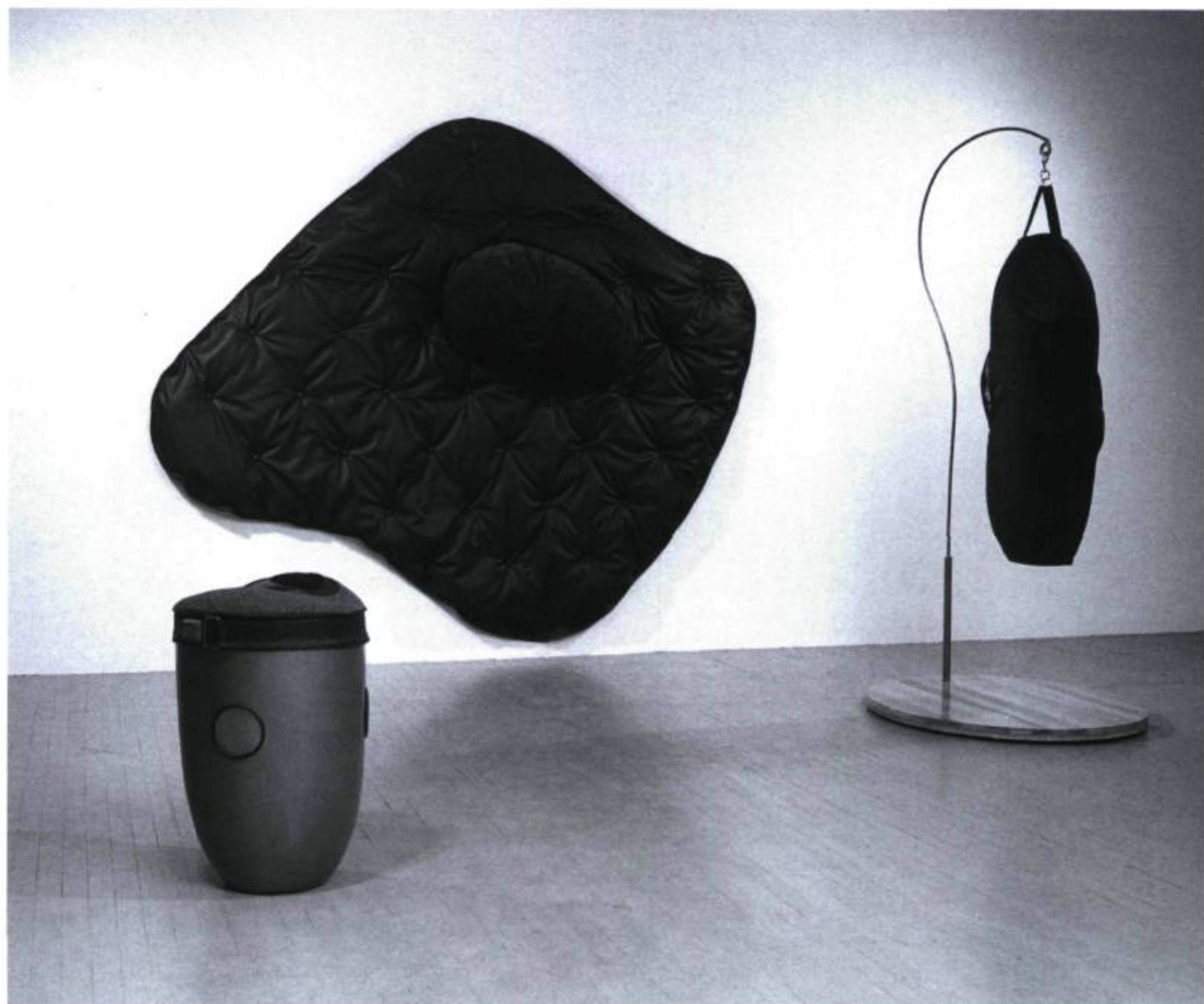
Paméla Landry, Centre de la cresse , 2001. Sculptures interactives avec sons. Trois éléments : Le poste des contentements ; L'aile de l'abandon ; Le rayon du besoin . Collection de l'artiste.

quête son sens à travers le montré du tragique des réalités particulières qui nous apparaissent, avec une telle acuité, dans les œuvres choisies.