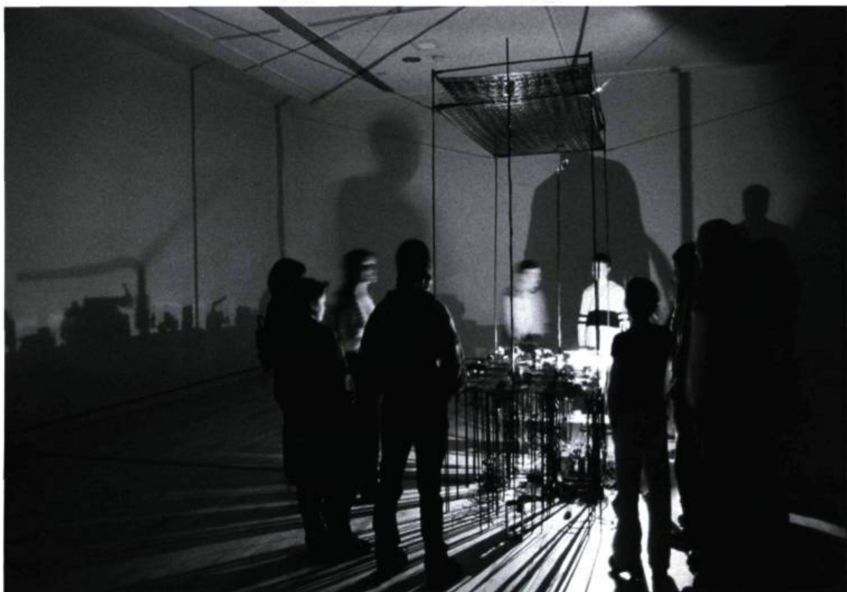
Diane Landry, les sédentaires clandestins , 2001. Installation lumineuse et sonore.

blancs, comme autant d'écrans sur lesquels se découpent les ombres issues de ce qui s'avère un appareil complexe de projection. La salle elle-même est dans le noir, alors que l'étrange automate – à l'allure d'un lit à baldaquin – s'active.