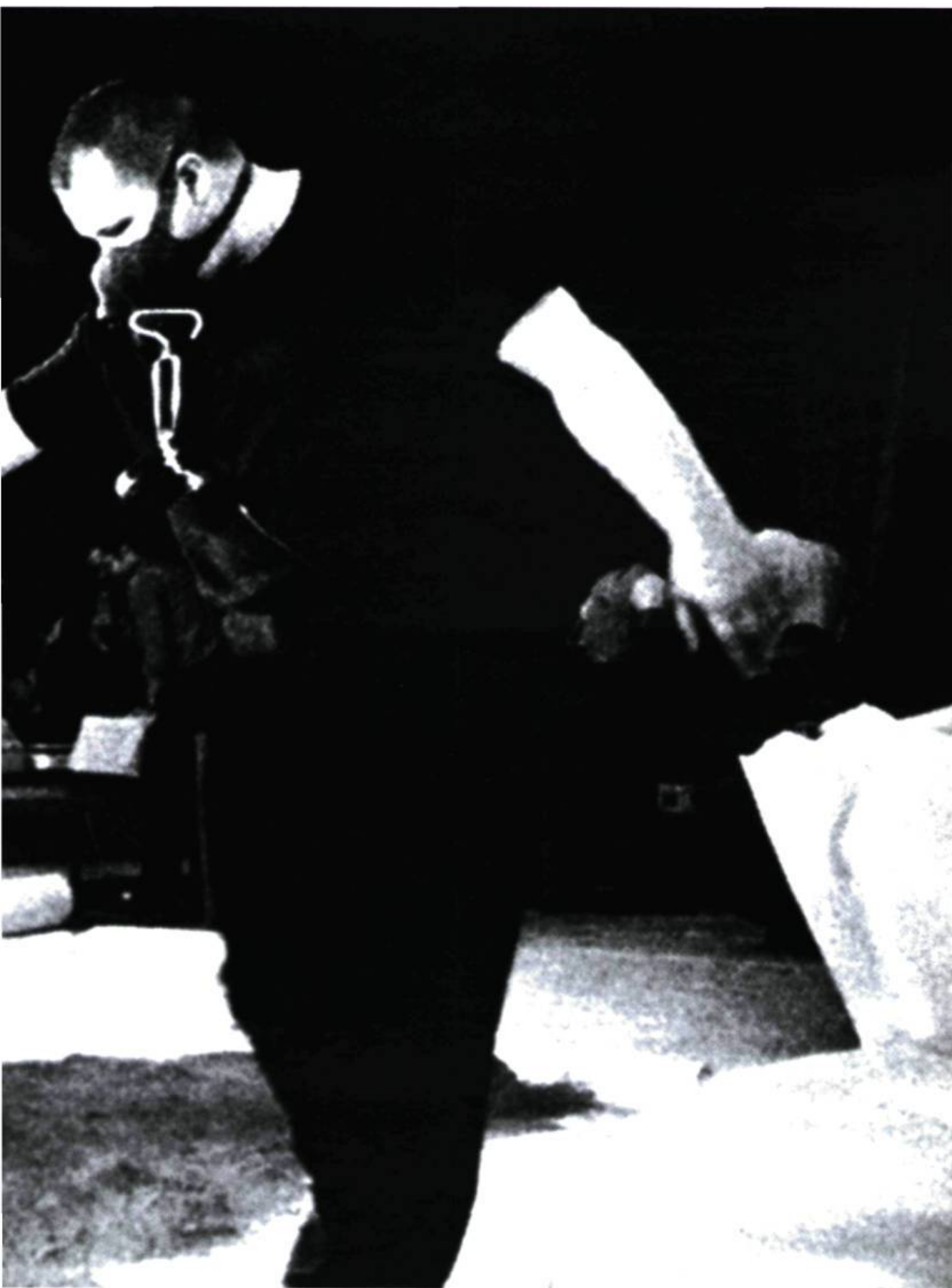
Wolf Vostell, Nie/wieder/jamais , Festival der neuen Kunst, Aix-la-Chapelle, 20 juillet 1964.