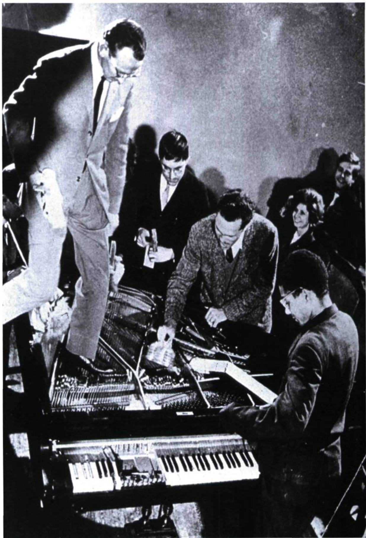
Philip Corner, Piano activities , Fluxus internationale Festspiele neuester Musik, Wiesbaden, 1962.