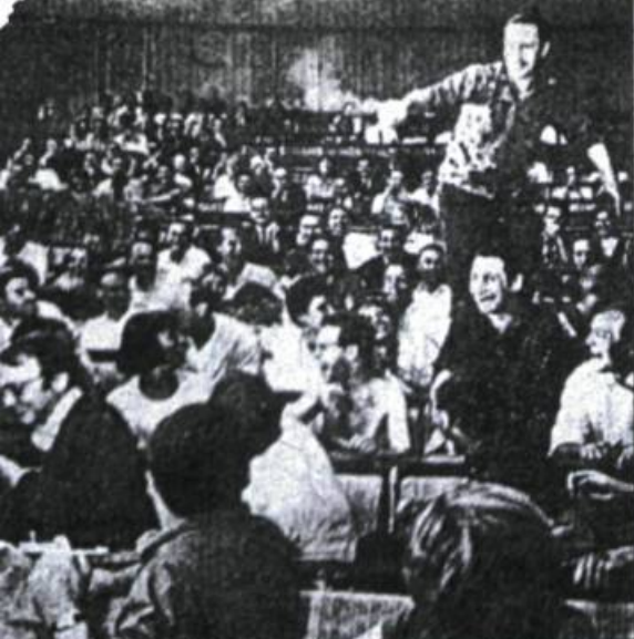
Einer besprüht das Publikum — Klamauk zum 20. Juli