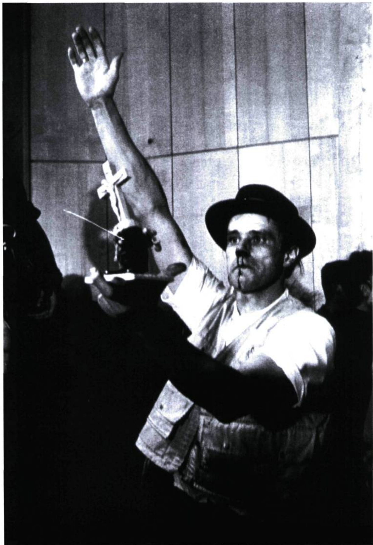
Joseph Beuys, Kukai, Apokee-nein, Braunkreuz, Fettecken, Modellfettecken , Festival der neuen Kunst, Aix-la-Chapelle, 1964.