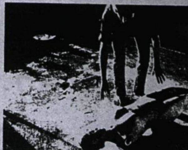
Zweiter Akt: nackte Puppe. Die Beziehung zum 20. Juli

Professor Beuys (43) nach der Veranstaltung zu REVUE: „Wir sollten an diesem Tage alles tun dürfen, was wir wollen... Ich kann nicht...“