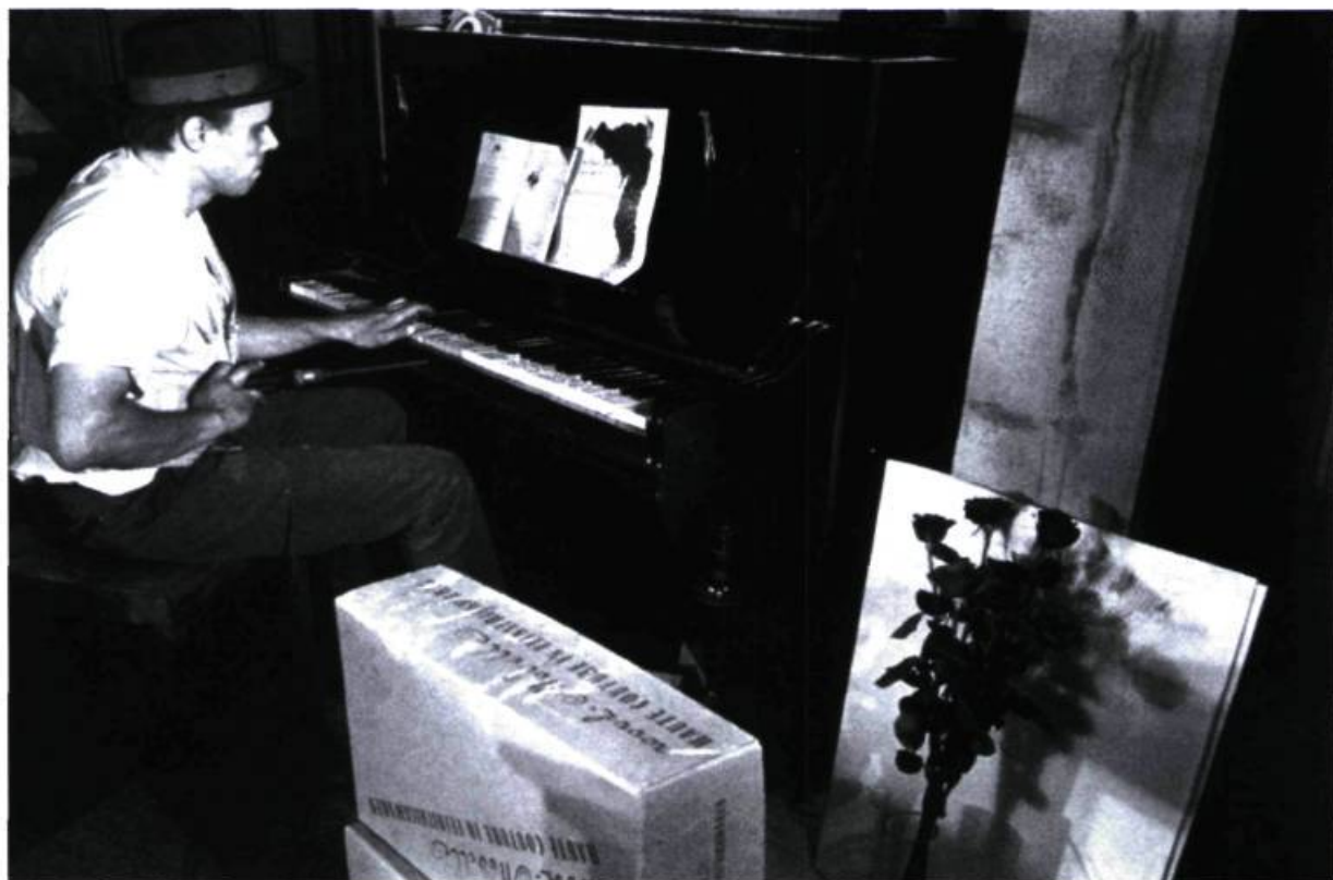
Joseph Beuys, Kukei, Apokee-nein, Braunkreuz, Fettecken, Modellfettecken, Festival der neuen Kunst, Aix-la-Chapelle, 1964.