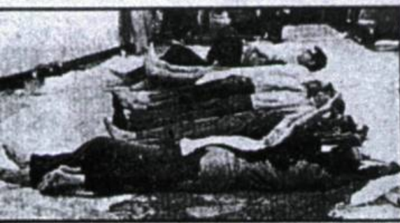
Toller Spuk — Erschießung der Widerstandskämpfer?