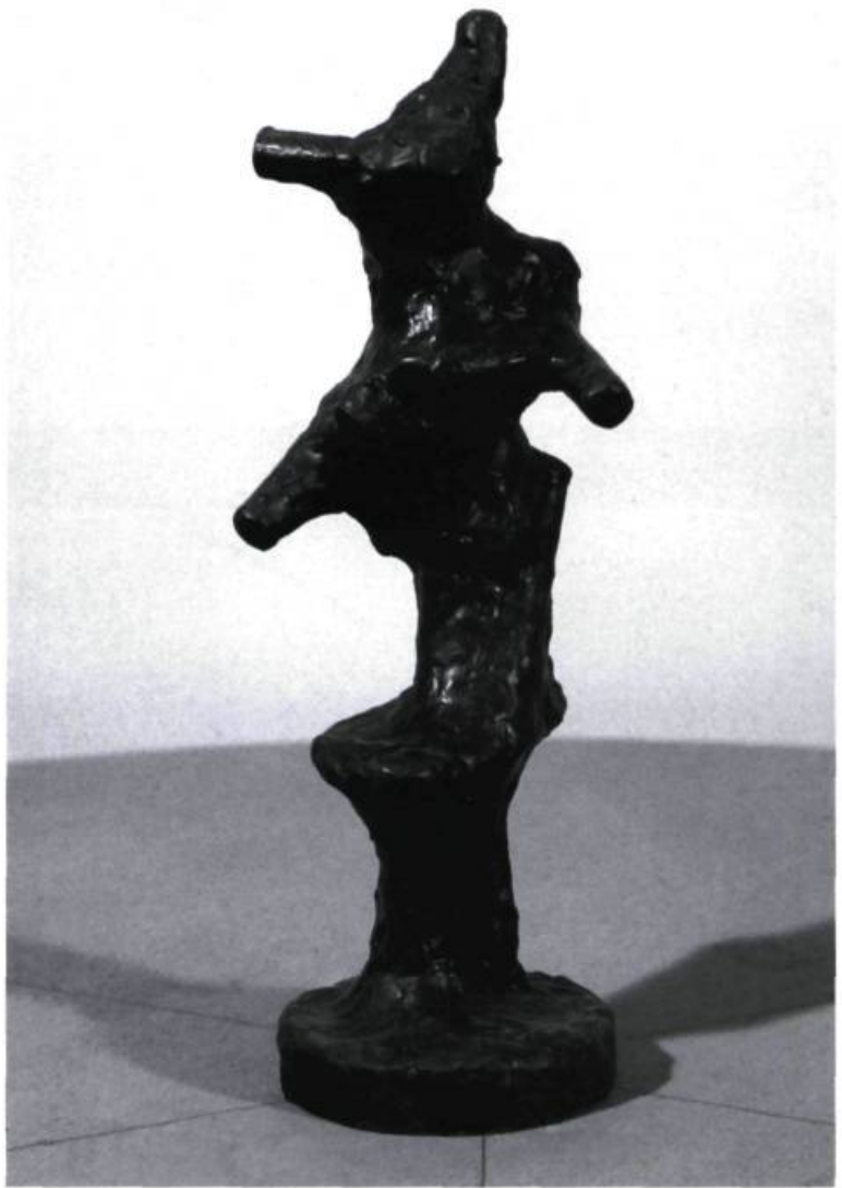
Ulysse Comtois, Sans titre , 1984. Cire; 36, 5 x 12 x 13 cm.

Le reflet du travailleur assidu, à l'image de « l'artisan » auquel on se plaisait à l'identifier, trouvait également écho dans son dense atelier de sculpture. Malgré un ralentissement de la production sculpturale de l'artiste au cours des quinze dernières années, celui-ci ne s'est jamais départi de l'équipement lourd des débuts, faisant contre-poids aux étagères truffées de sculptures de moyens et petits formats qui tapissent les murs. La passion du travail hantait encore les lieux de cette sorte d'atelier-laboratoire au sein duquel Comtois s'est engagé à construire une œuvre insolite qui a su coupler la tradition du travail