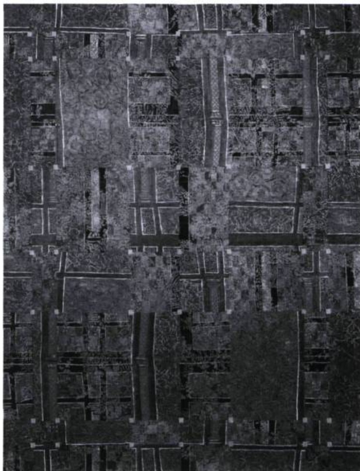
François Rouan, Peintures, dessins . Catalogue de l'exposition, juillet-septembre 1978. Marseille, Musée Cantini, 1978.

I l pourrait s'agir d'une question de temps ou bien d'histoire et surtout d'une interrogation sur la relativité telle qu'on la décrit banalement, pour la faire comprendre aux enfants : des trains ne roulant pas à la même vitesse sur des voies parallèles se dépassent dans le meilleur des cas, se croisent aussi, additionnant leurs vitesses. Les publics, les admirateurs, les spectateurs, les dégustateurs d'œuvres d'art ou bien de monuments architecturaux ne seraient-ils pas, eux aussi, dans des temps différents, dans des regards différents alors qu'ils existent dans le même espace physique ? Le voisinage quotidien d'œuvres nous transpercerait de références mémorielles, l'étonnement de la première approche nous séduirait ou nous irriterait, selon notre humeur, notre culture, nos archives.