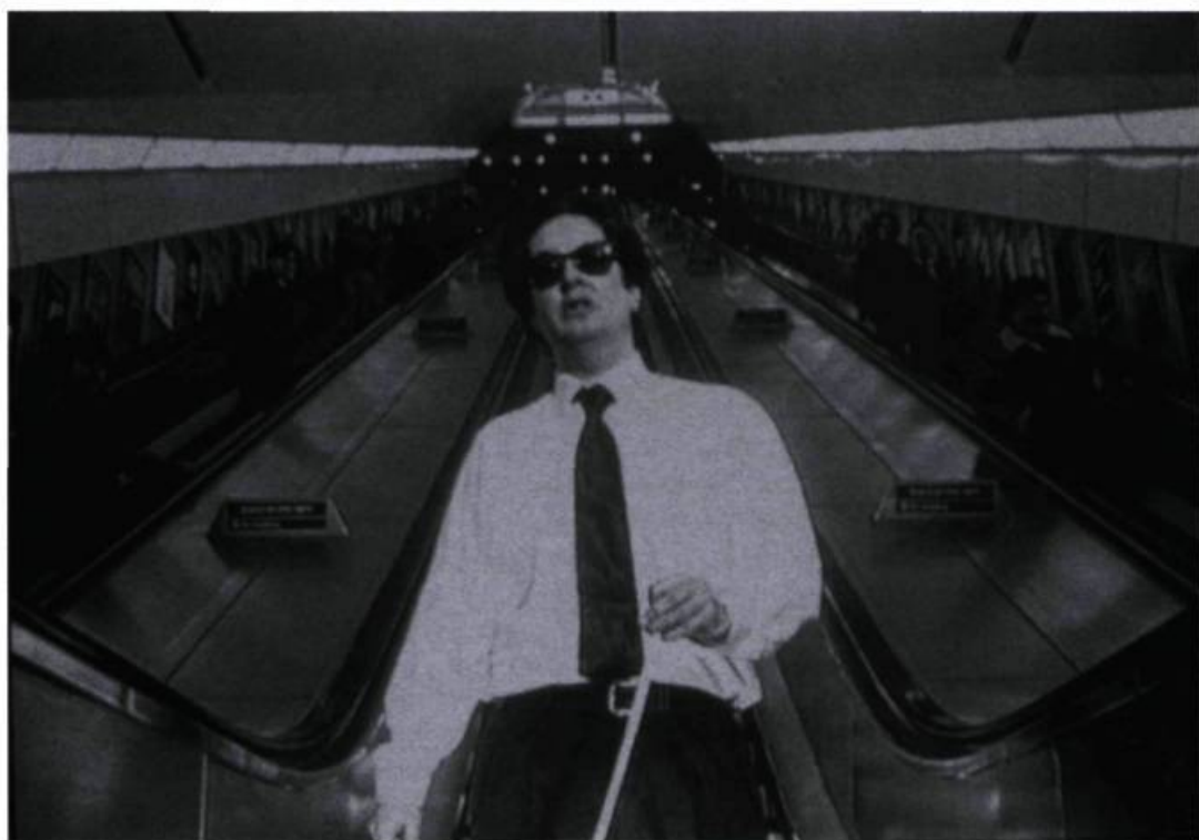
Mark Wallinger, Angel , 1997. Vidéogramme, 7' 30". Édition de 10 + 2 AP.

Biennale de Montréal '98, Centre international d'art contemporain de Montréal, Montréal. Du 27 août au 18 octobre 1998