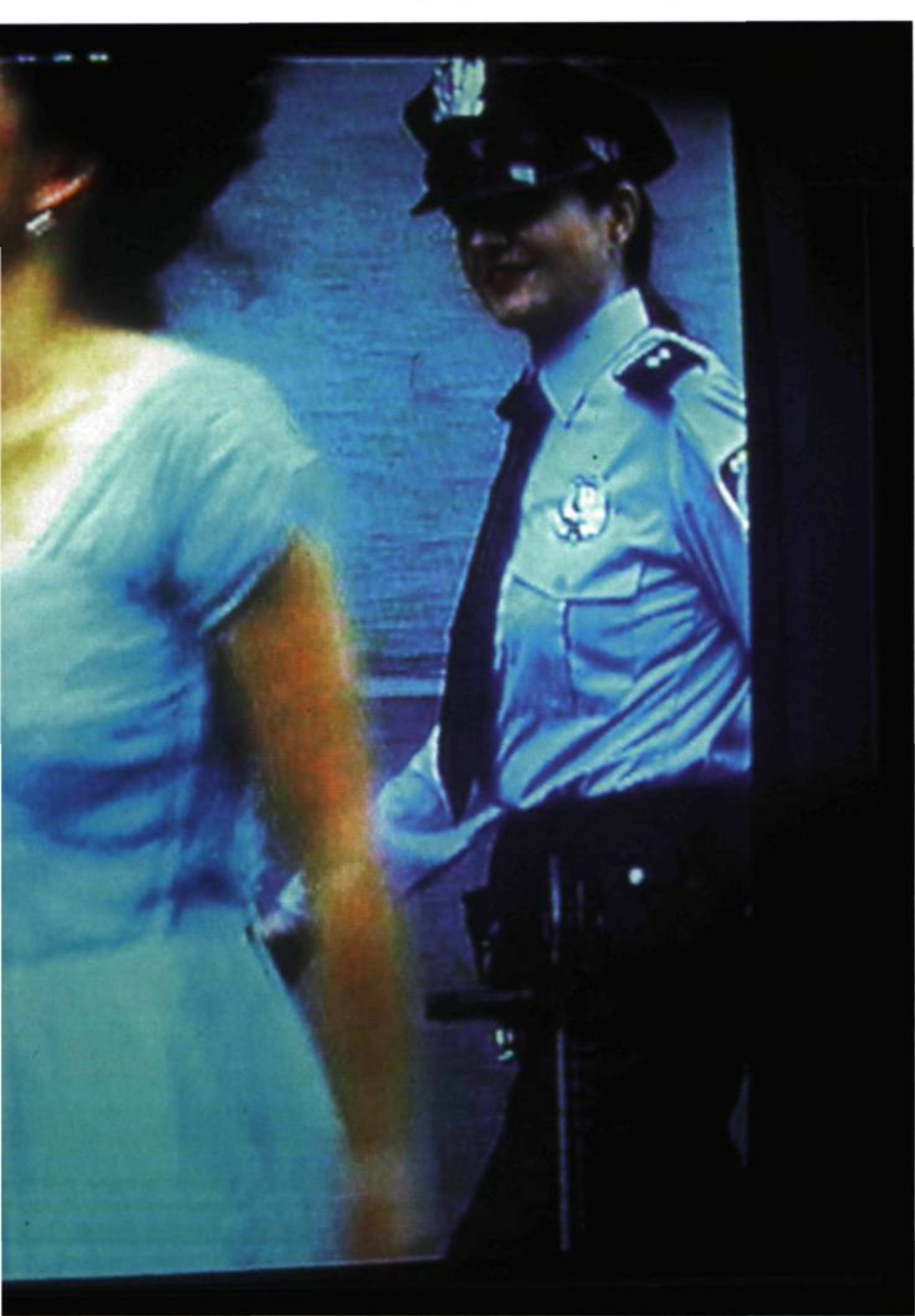
Pipilotti Rist, Ever is Over All , 1997. Installation vidéo.

d'objets linguistiques de cette histoire singulière de l'image. Au sens propre comme au sens figuré, la reconstruction est à l'œuvre. Au grenier (deuxième étage), originellement installée en 1971 dans une cave de Düsseldorf, la Section Cinéma du fameux Musée d'Art Moderne, Département des Aigles , expose les boîtes — documents stockés dans les coulisses un peu chaotiques du septième art — et mène, arrivé au bout de la phrase, à un étalage sous vitrine des éditions livresques de l'artiste. Cependant, le point