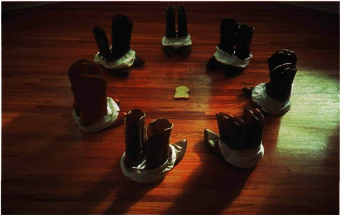
Evergon, Gunfight at the OK Corral , 1996. Photographie.

L'inscription de la sexualité dans la structure socio-sémantique de l'œuvre d'art actualise et perpétue la part profonde de nous-mêmes. Notre conception de ce qui est aberrant, comme nos idées concernant la morale, sont les héritières de la tradition judéo-chrétienne. Les discours sociaux, les imaginaires collectifs et les systèmes symboliques hérités d'une sexualité socioculturelle stéréotypée sont remis depuis déjà un bon moment en question, par la représentation de nos désillusions qui va de pair avec l'effondrement des idéologies dont les sentiments dominants sont la déception et la négativité. Les icônes contem-