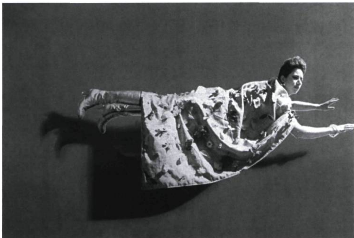
Carol Sawyer, Amazon , 1998. Installation.

La sexualité n'est plus réduite à ses communs dénominateurs, à ses fonctions vitales, aux gestes « dérisoires » et nécessaires du rituel quotidien. Elle porte souvent le flambeau d'une guerre contre la société, d'un appel à la transgression et d'une révolte contre des individus dont les comportements sont abusifs et sans fondement. La sexua-