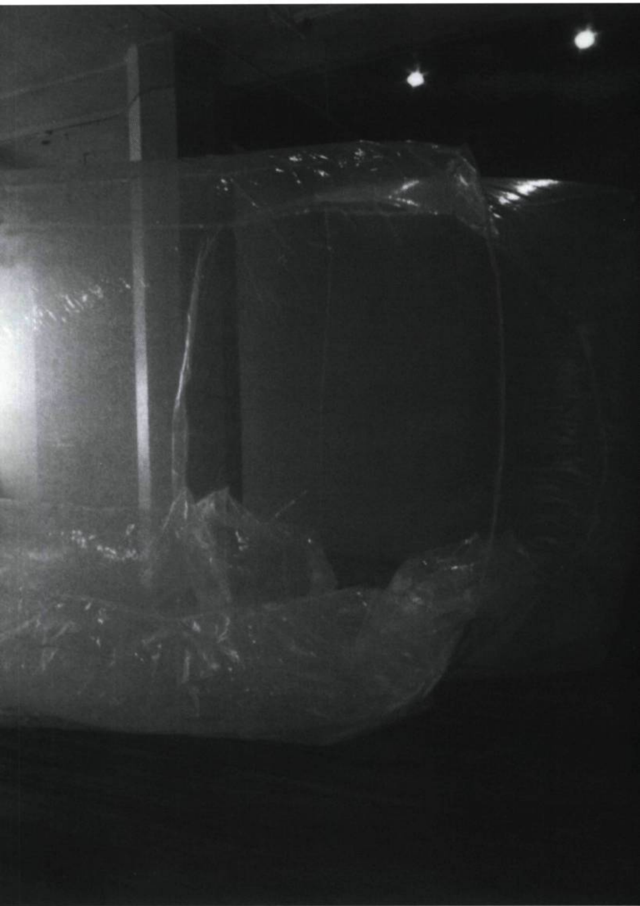
Anna Amadio, Révéléateur d'espace , 1994. Plastique transparent, air.