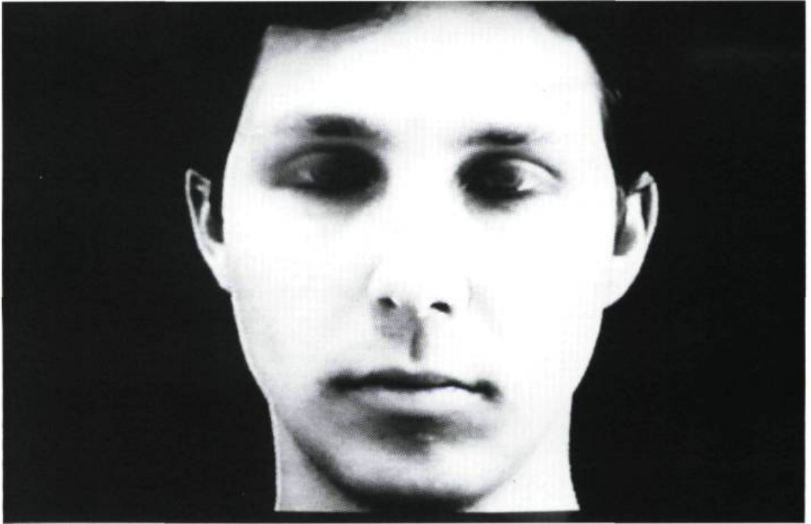
Bertrand R. Pitt, Le bruit des yeux (extrait de la bande vidéo), 1996.

Bertrand R. Pitt et Anna Amadio, Occurrence, Montréal. Du 13 avril au 12 mai