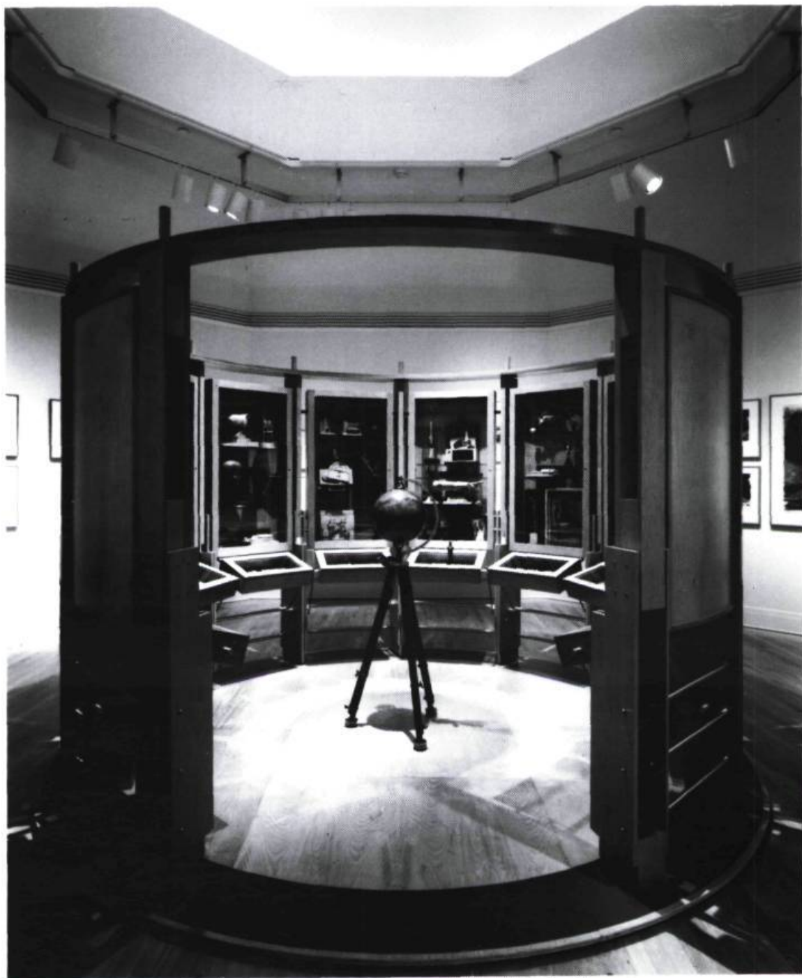
Richard Henriquez, Le Théâtre de la mémoire (vue de l'intérieur). Jeffrey Pelton et B & B. Scale Models, maquettistes; Herbert Schroy, artisan du métal; Granville Island Woodworks, ébénistes. Collection de l'architecte Richard Henriquez.