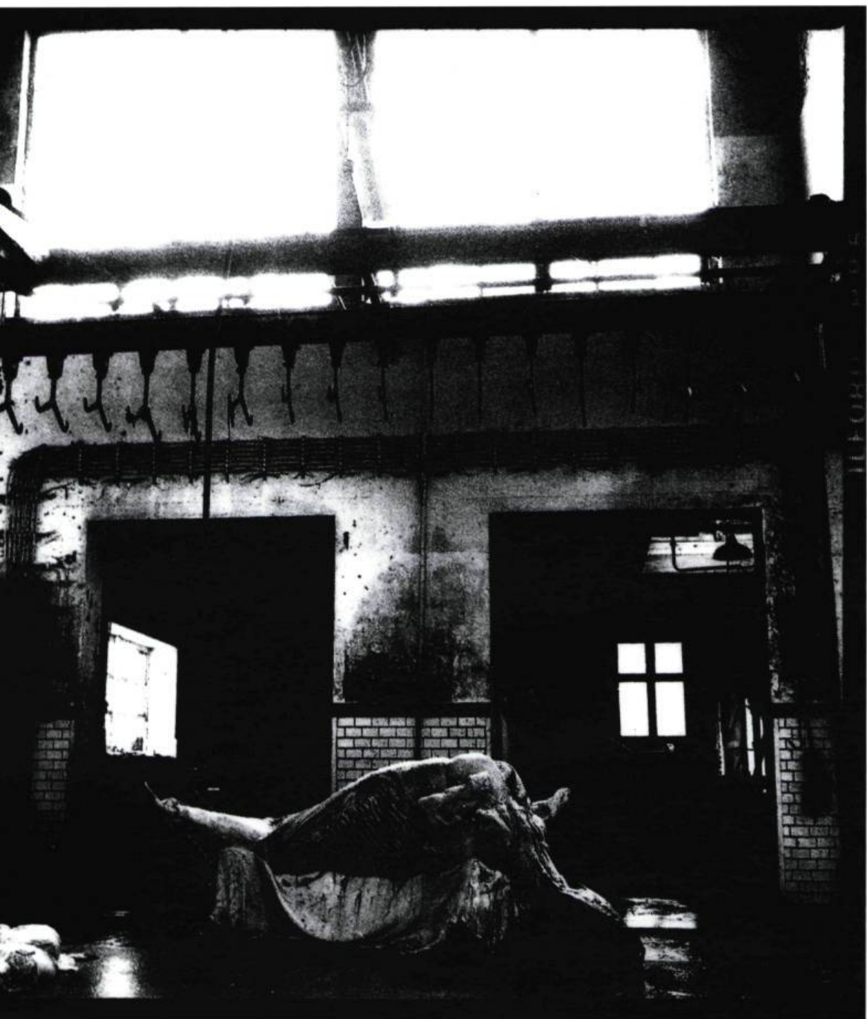
Marc Trivier, Abattoir VI , 1982.