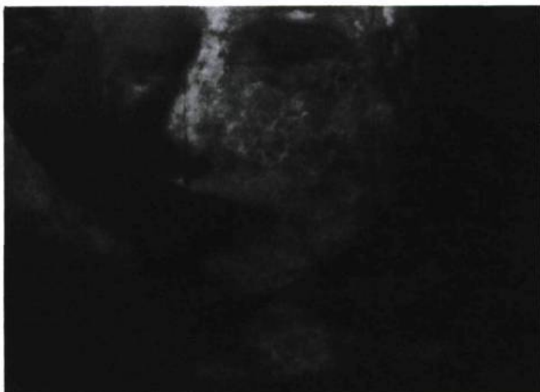
France Choinière, Projection 1 , de 24 images muettes de la seconde dernière, 1991.

En dehors de soi, jeunes photographes 1992, Galerie Dazibao, Montréal.