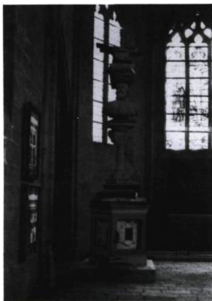
Pierre Ayot, Les grandes aventures de Benvenuto Cellini , 1989. Techniques mixtes sur bois ; 518 x 152 x 152 cm. Collection de l'artiste.