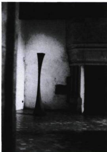
Jocelyne Allouche, Solstice (détail) , 1992. Photographies noir et blanc, bois laqué, verre teinté, clair et dépoli, graphite et plomb ; 224 x 620 x 930 cm. Collection de l'artiste.