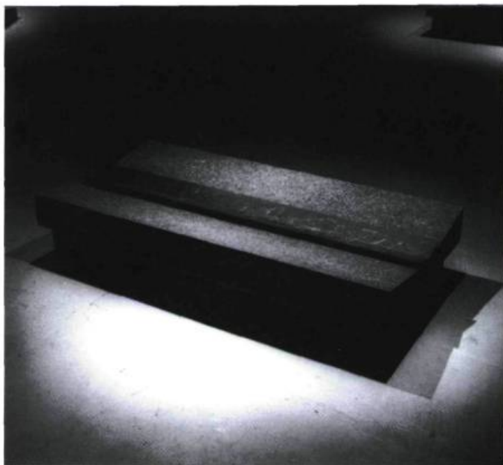
Marie-France Brière, Fantômes , 1991. Granit.

Sous l'apparence de formes cérémonielles rattachées au sol, le granit des pierres a le pouvoir de faire éclore le corps comme source originare de la forme. Le corps semble fuir mais on ne sait pas vers où. L'artiste fait en sorte que le visible et le non-visible se heurtent, l'apparent et son manque, le travail réel et le visible irréel. L'installation assimile le modèle, l'homme physique, en le rendant transparent. Dans l'expérimentation de la matière, l'épiderme