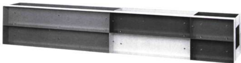
Donald Judd. Pulvérisation sur aluminium, 1984

P aris : Donald Judd — Pour la première fois en France, l'œuvre de Donald Judd vient de faire l'objet d'une rétrospective. Fidèle à une politique qui consiste à alterner d'importantes manifestations de caractère international et des expositions réservées à de plus jeunes talents, l'A.R.C. (Musée Municipal d'Art Moderne) a accueilli cette grande rétrospective, qui, après Eindhoven, Düsseldorf et Paris, sera présentée à Barcelone.