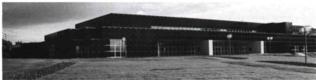
Musée d'Art Moderne de Saint-Étienne