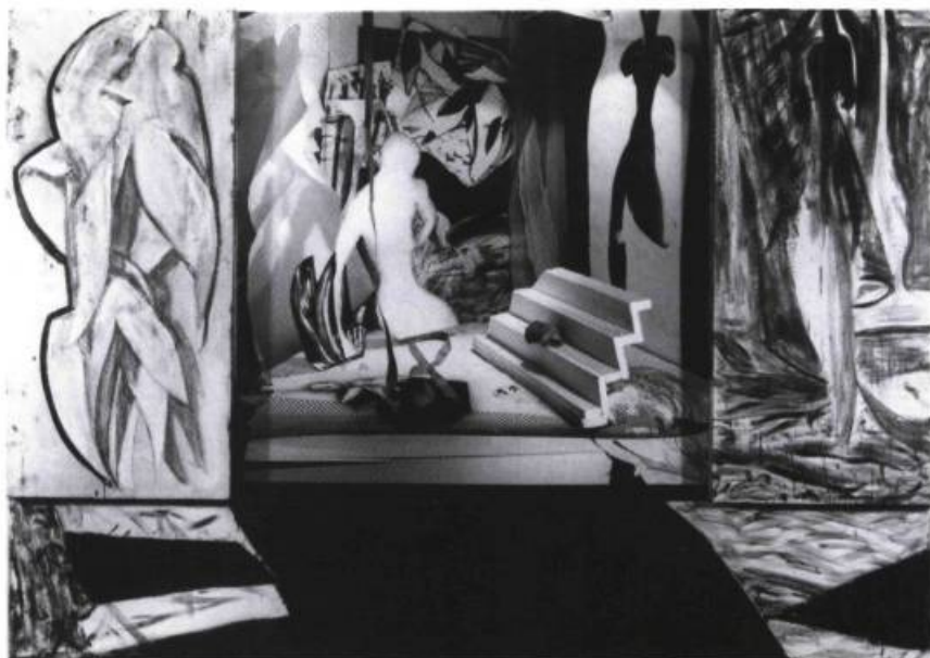
Suzanne Gauthier, Retable , 1987. Photographie, graphite sur bois et encaustique; 70x98 po