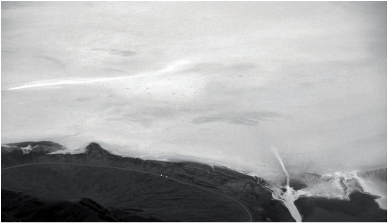
Nelly-Ève Rajotte Koe , 2013.