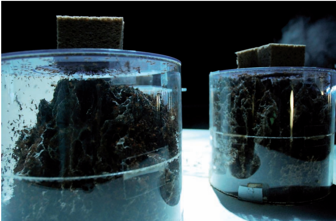
Robin Meier & Ali Momeni The Tragedy of the Commons, vue d'installation | installation view, Palais de Tokyo, Paris, 2011. Photos : Aurélie Cenno, © Robin Meier & Ali Momeni