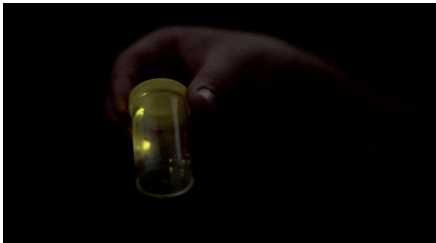
Robin Meier & André Gwerder Synchronicity (Thailand) , produit par Audemars Piguet Art Commission, 2015.