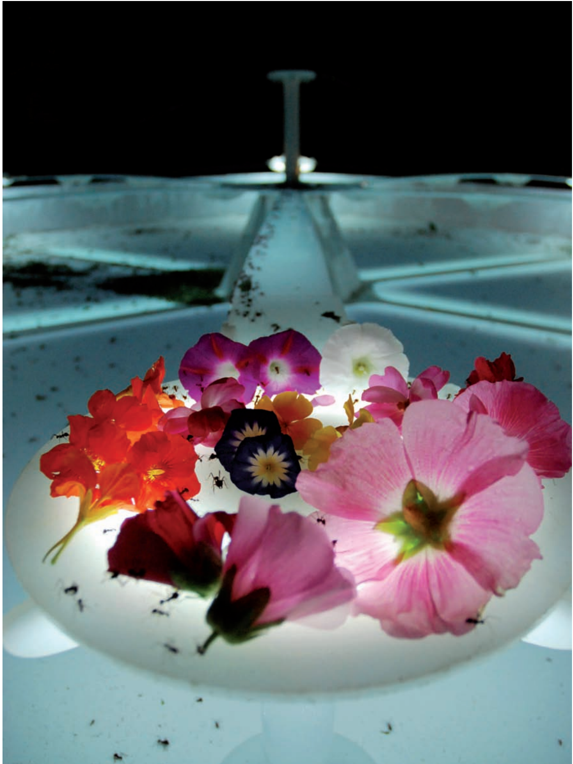
Robin Meier & Ali Momeni The Tragedy of the Commons , vue d'installation | installation view, Palais de Tokyo, Paris, 2011. Photo : Aurélie Cenno, © Robin Meier & Ali Momeni