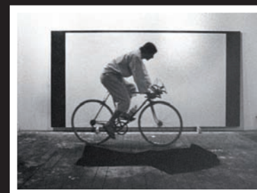
Charles Gagnon, Le son d'un espace , 1968.