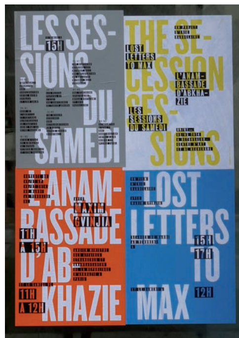
Eric Baudelaire, The Secession Sessions , Bétonsalon – Centre d'art et de recherche, Paris, 2014. Photo: © Ségolène Thuillart permission de | courtesy of Eric Baudelaire