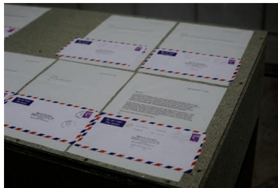
Eric Baudelaire, The Secession Sessions , Bétonsalon – Centre d'art et de recherche, Paris, 2014. Photo: © Ségolène Thuillart permission de l'artiste | courtesy of the artist

he used to do as a minister: persuade, greet, and interpret official discourse. There is nothing at issue here but “representation,” whether it be diplomatic, artistic, or theatrical. The essential meaning of this word is understood so thoroughly that it renders something absent present. It is precisely here that the example of Abkhazia critically brings to light the general game of diplomacy: figuration dramatized in an elusive fiction that could be called the national novel. Moreover, the exhibition is the stage