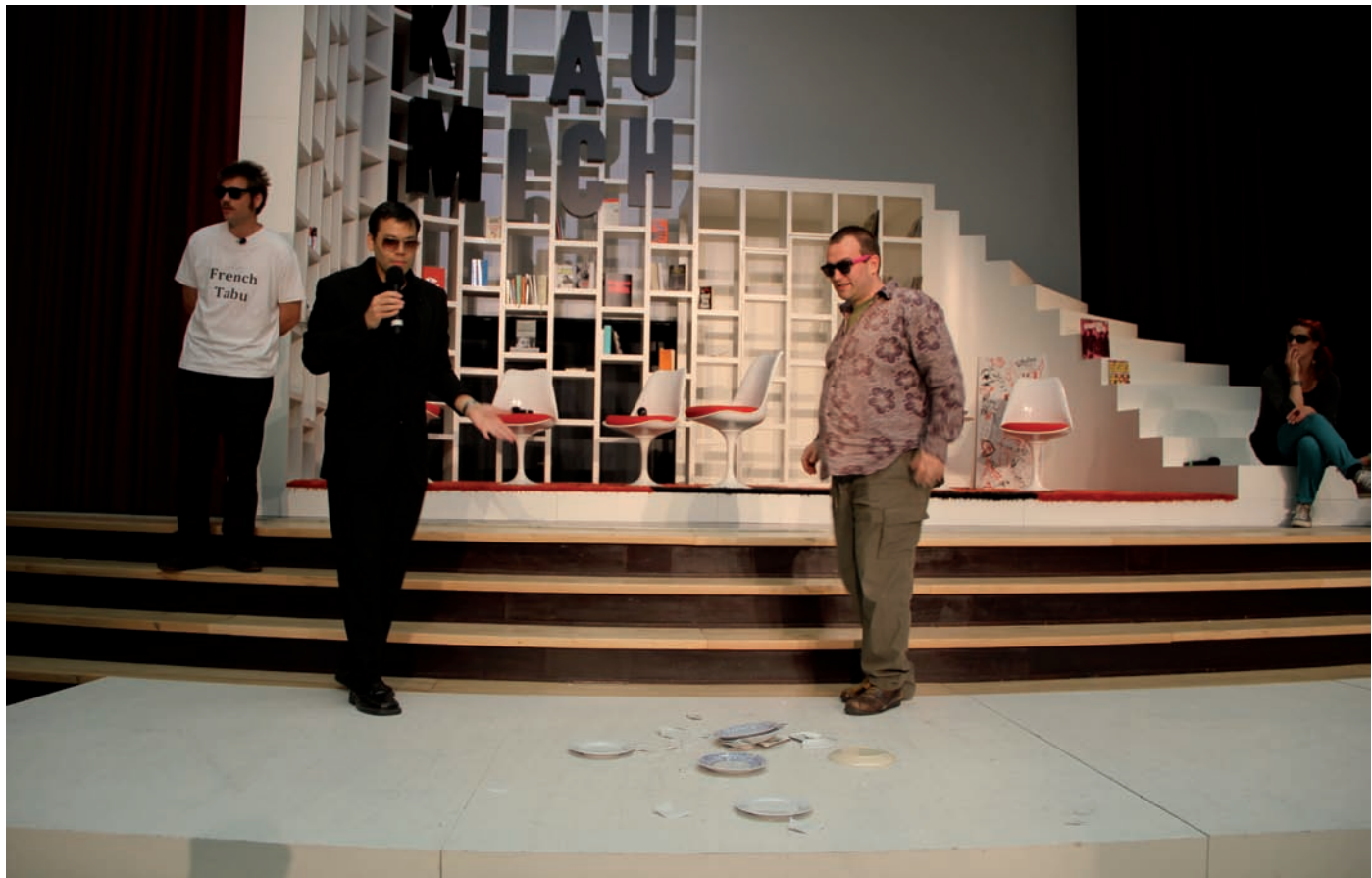
Dora García, Die Klau Mich Show: Radicalism in Society Meets Experiment on TV , dOCUMENTA13, Kassel, 2012.

Photo: Lauren Huret, © Dora García, Theater Chaosium & dOCUMENTA13, Kassel permission de l'artiste | courtesy of the artist