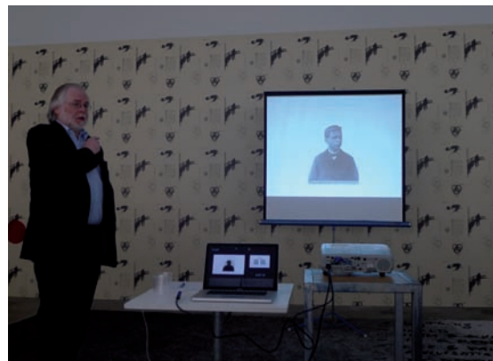
Dora García, Mad Marginal, 2009-2014.