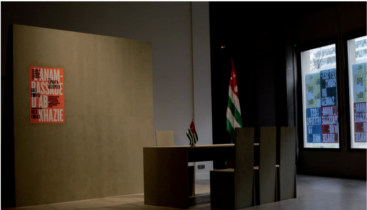
Eric Baudelaire et Maxim Gvinjia, The Secession Sessions , Bétonsalon – Centre d'art et de recherche, Paris, 2014.