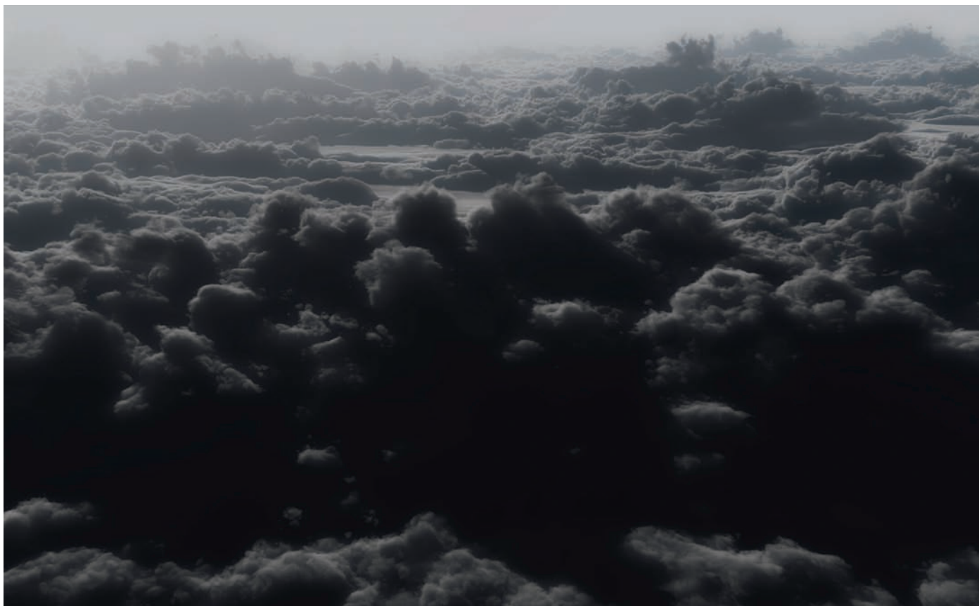
Nicolas Baier, Réminiscence , 2012.