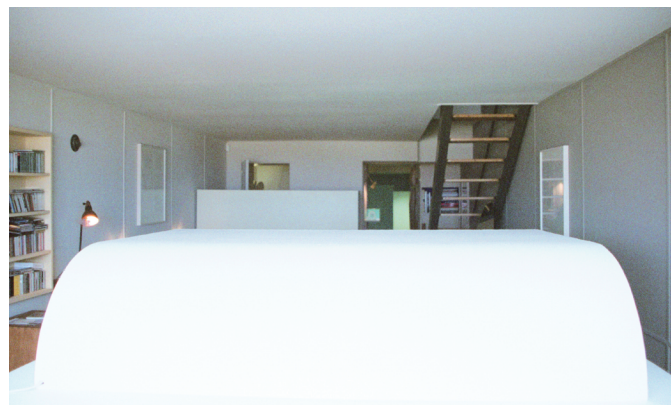
Cellule516, Absalon – Habiter la contrainte , Marseille, 2013.