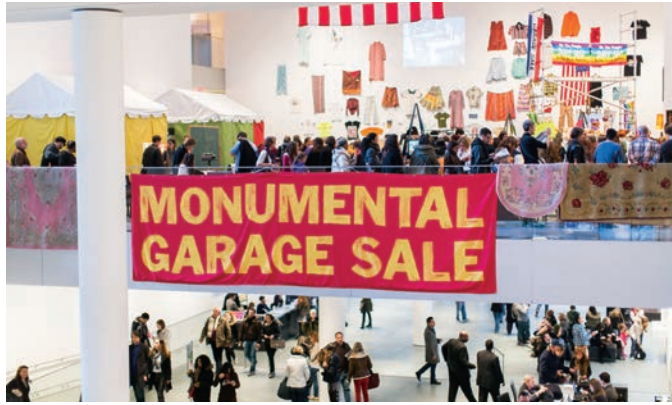
Martha Rosler, Meta-Monumental Garage Sale , vue d'installation, The Museum of Modern Art, New York, 2012.