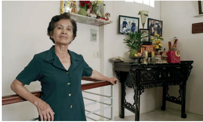
Arno Gisinger, Vétérans , 2007.