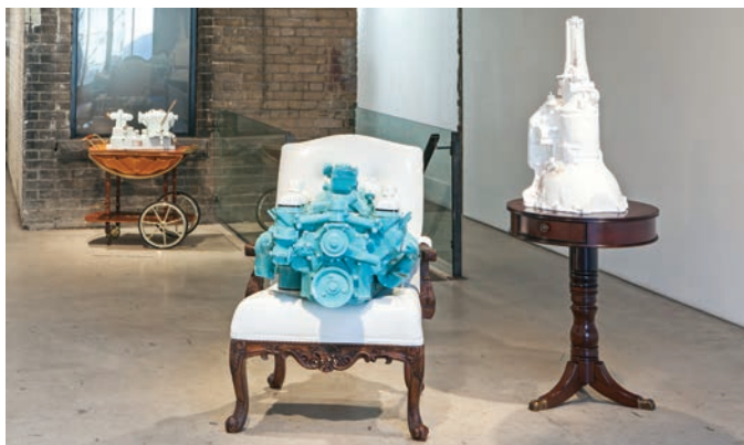
Clint Neufeld, installation view, 2013