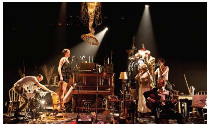
L'Orchestre d'Hommes-Orchestres, Kurt Weill : Cabaret brise-jour et autres manivelles , 2012.