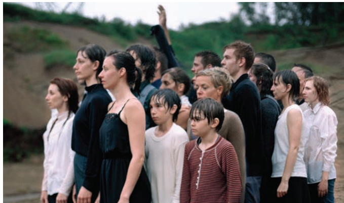
Jacynthe Carrier, Parcours , 2012.