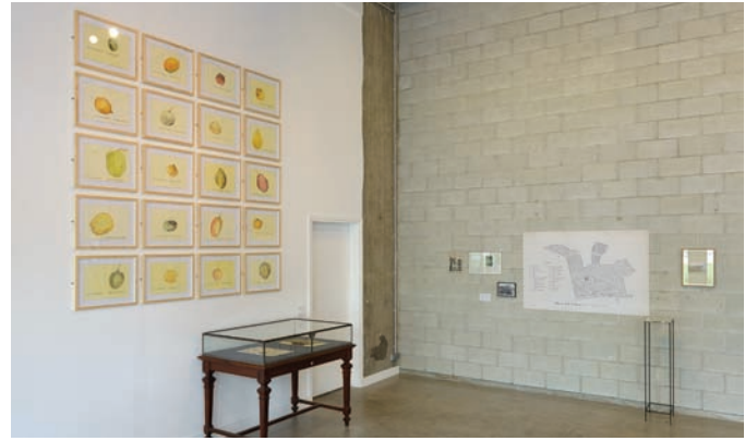
Vue d'exposition, Tropicomania : La vie sociale des plantes , Bétonsalon, Paris, 2012.