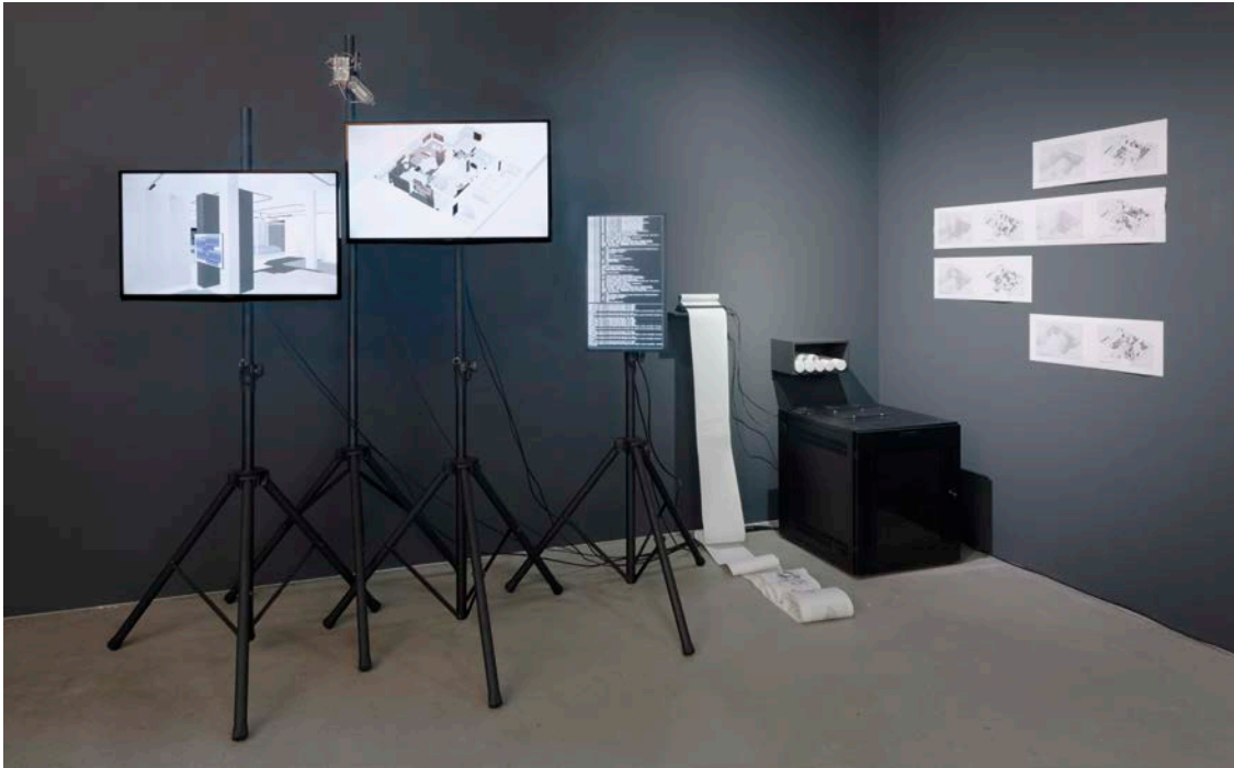
fabric | ch , Atomized (curatorial) Functioning , 2019. Dispositif automatisé d'exposition, 3 écrans, un serveur, un Raspberry Pi, une imprimante thermique, impressions.

territoires digitaux. Aujourd'hui, à travers les projets plus récents de fabric | ch, nous continuons à interroger notre espace contemporain, que ce soit dans les enchevêtrements entre notre réalité physique et notre réalité numérique ou l'émergence de nouvelles pratiques de design. À ce titre, dans notre dernier projet intitulé Atomized (curatorial) Functioning , nous nous sommes tournés vers les processus d'automatisation et d'intelligence artificielle qui prennent une place de plus en plus grande dans nos modes de travail.