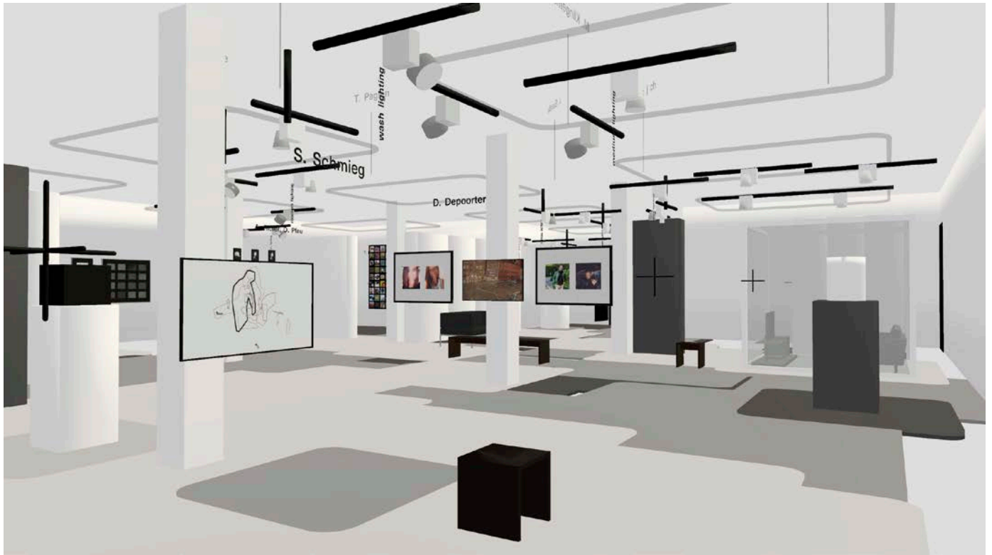
fabric | ch, Atomized (curatorial) Functioning , 2019. Configuration d'exposition.