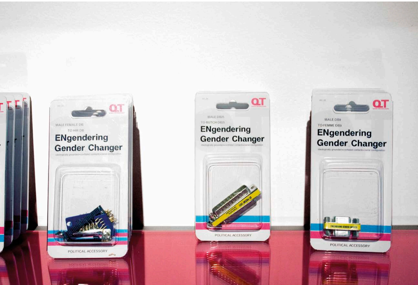
Zach Blas, Queer Technologies: ENGenderingGenderChangers , 2008. Détail de l'installation, New Wight Gallery, Université de Californie, Los Angeles.