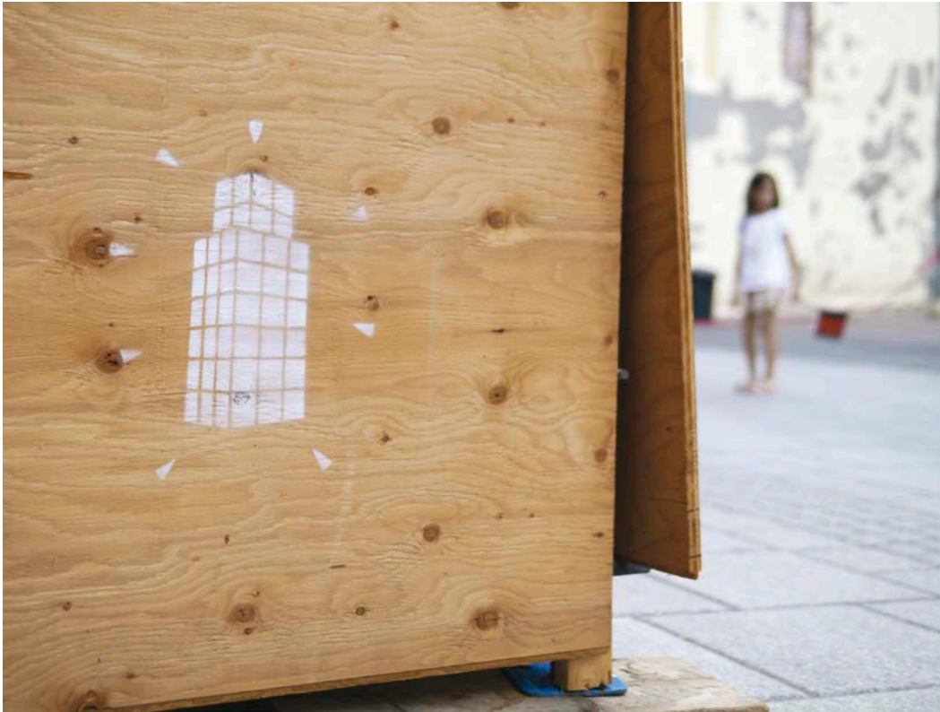
Wartin Pantois, Hommage à Jean Pierre Raynaud , 2015. Peinture aérosol, pochoir, rue Notre-Dame, Québec.

d'ailleurs accentué lors de l'inauguration de la Place de Paris, célébrée en grande pompe en présence d'une fanfare et de soldats en uniforme du régiment de Montcalm. Il semble que le dialogue historique et artistique proposé par l'artiste échappe ainsi à la majeure partie des usagers de la place. À cet égard, remarquons que le titre de l'œuvre est régulièrement escamoté au profit du sobriquet simpliste de « cube blanc », désignation qui, en plus d'être réductrice, est inexacte : la notion de dialogue entre les siècles et entre les peuples français et québécois est de cette manière évacuée.