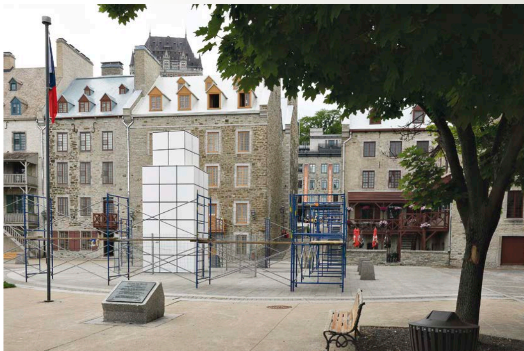
Jean Pierre Raynaud, Dialogue avec l'histoire, 1987-2015. Source : Le Soleil, 17 juin 2015.