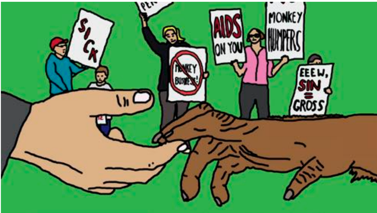
Duke and Battersby, Lesser Apes , 2011. Image tirée de la vidéo, couleur, son, 13 min.

Les relations entre les singes bonobos sont les plus proches des relations humaines, et ceux-ci vivent dans une société matriarcale. Eux aussi, comme Duke et Battersby le mentionnent sur leur site web, « vivent sans conflit et sont sans vergogne sexuelle. » Meema l'est certainement. Elle est une autre messagère du monde animal aux humains, dont l'enthousiasme franc et l'exploration active des concepts humains la distinguent des guides plus avisés qui apparaissent dans les autres vidéos de Duke et Battersby.