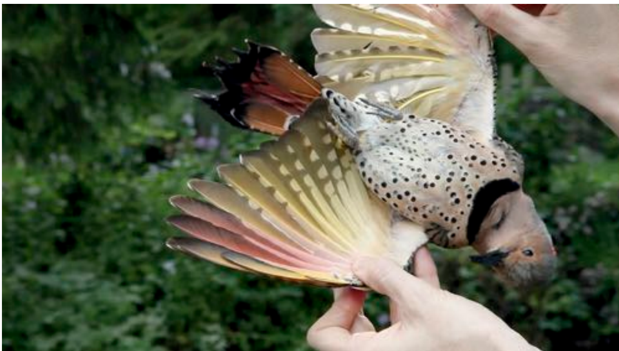
Duke and Battersby, Here Is Everything , 2013. Image tirée de la vidéo, couleur, son, 15 min.

Le plus surprenant dans l'œuvre de Duke et Battersby, ce sont les traits de caractère de Meema. Ce qui semble à première vue être de la naïveté, son ouverture à l'idée de la perversion et la conviction qu'elle peut aider les humains, est rapidement retournée contre nous – son discours nous est si étranger que ce sont nos propres limites qui sont testées; il n'y a aucune incompréhension de sa part. Peut-être que Meema ne juge pas bien les humains, mais ce n'est pas naïvement. Lesser Apes traite essentiellement de l'idée de la perversion – les « autres » comportements que la société humaine trouve inacceptables – alors que du point de vue du primate, c'est exactement le courage d'aller au-delà des normes, qui ouvre la possibilité d'une réelle communication entre les espèces. Du point de vue d'un animal, qu'est-ce qui est interdit? Si l'humain n'est plus au centre, comment « l'altérité » se joue-t-elle dans la sphère élargie des relations? Et est-ce que l'idée de la perversion ouvre des portes, tel que Meema le souhaite?