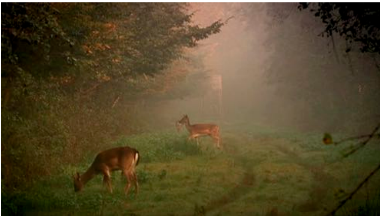
Duke and Battersby , Beauty Plus Pity , 2009. Image tirée de la vidéo, couleur, son, 15 min.

Adopter, ou plus correctement, imaginer, le point de vue d'un animal est souvent une tentative pour saisir l'ineffable – pour réellement connaître l'autre, cette altérité familière de la présence animale dans nos vies. Nous nous efforçons de connaître les autres de façon à surmonter notre isolement fondamental – donner du sens est une façon de s'approprier; après tout, chaque tentative de compréhension s'avère une tentative de communication. Y a-t-il quelqu'un ou quelque chose à l'écoute ?