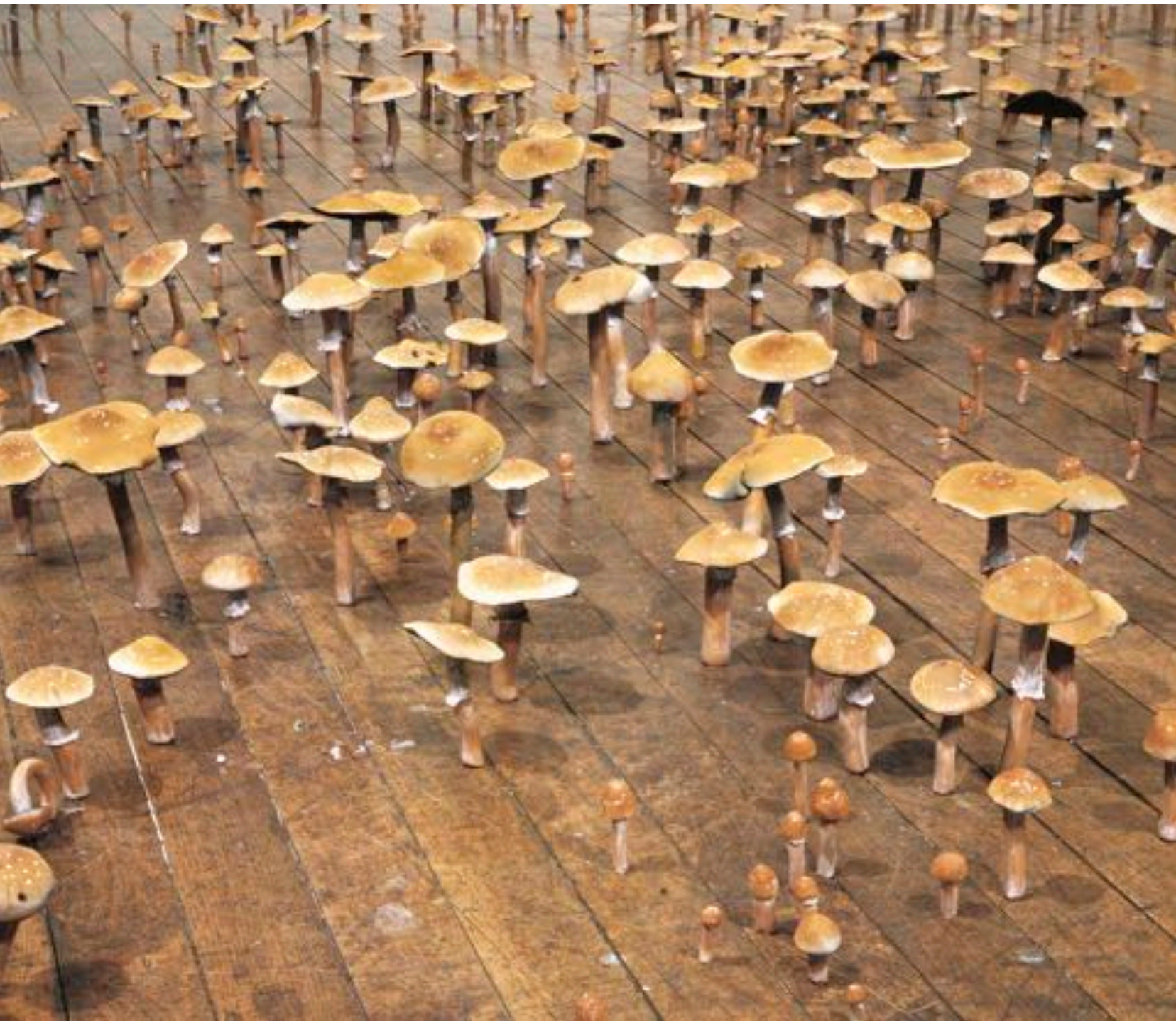
Roxy Paine , Psilocybes Cubensis Field , 1997.