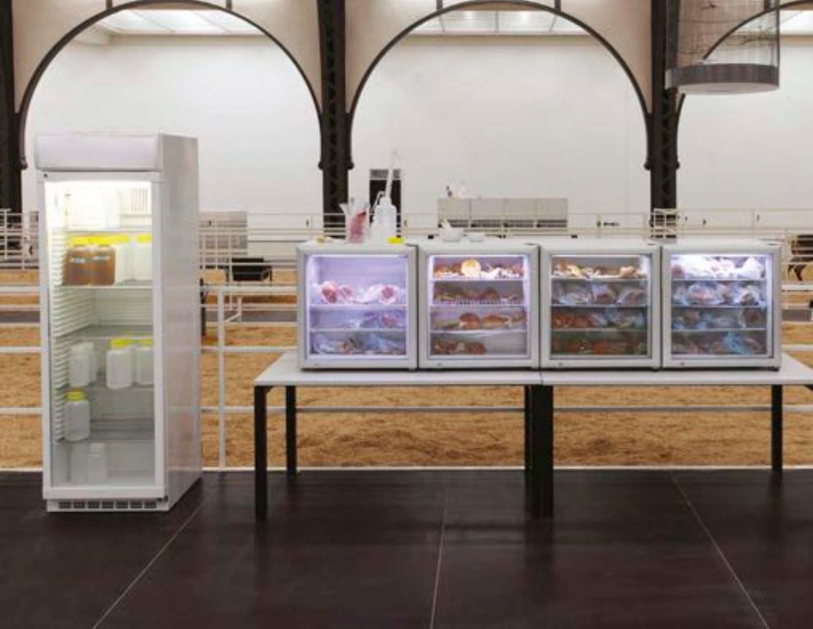
Carsten Höller , Soma , 2010. Vues de l'installation, Hamburger Bahnhof, Berlin 2010. © VG Bild-Kunst 2010/Carsten Höller. Avec l'aimable permission des galeries Air de Paris et Esther Schipper. Photo : Attilio Maranzano.