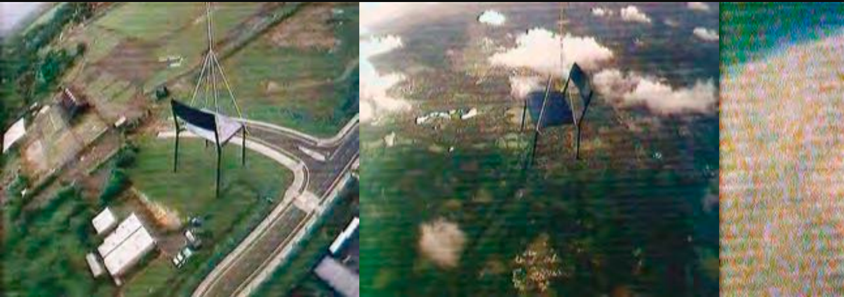
Simon Faithfull, Escape Vehicle no.6 , 2004. performance/vidéo, 25 min. © de l'artiste.

Lors d'une conférence 4 , il relate l'histoire de l'invention des objets volants les plus improbables pour transgresser les lois de la physique, à mi-chemin entre recherche scientifique et machine d'évasion folle, version série B. À son tour, l'artiste réalise une performance et un film dans les pas de Samuel Cody au Royal Aircraft Establishment, connu pour le premier vol en aéroplane de l'histoire aéronautique anglaise, accompli en 1908. Ultime tentative d'une série plus ou moins fructueuse, il crée, avec Espace véhicule n° 6 (2004), un dispositif de fortune pour entrer dans l'espace. Ingénieur bricoleur, il y envoie une banale chaise attachée à un ballon-sonde et filmée par une caméra connectée à un émetteur-récepteur mobile. Après quelques minutes, la courbe de la Terre apparaît, puis une ligne entre le bleu du ciel et le noir de l'espace. L'image brouillée et le précaire balancement de la chaise entretiennent une vision angoissante, accentuée par les ruptures de signal. La fin inéluctable de cette ascension voue la chaise à la désagrégation.