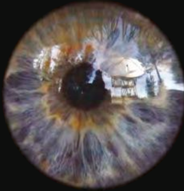
Simon Faithfull, Aurora Borealis (Unseen) , 2008. Vidéo projection sur deux écrans, 5 min. © de l'artiste

filmé en gros plan, rétrécit progressivement pour n'être plus qu'un point rouge abandonné au milieu d'un champ, lequel se transforme à son tour en un patchwork géométrique vu du ciel. Trente-deux minutes plus tard, la caméra enregistre la courbe de la Terre avant de disparaître dans la noirceur de l'Univers.