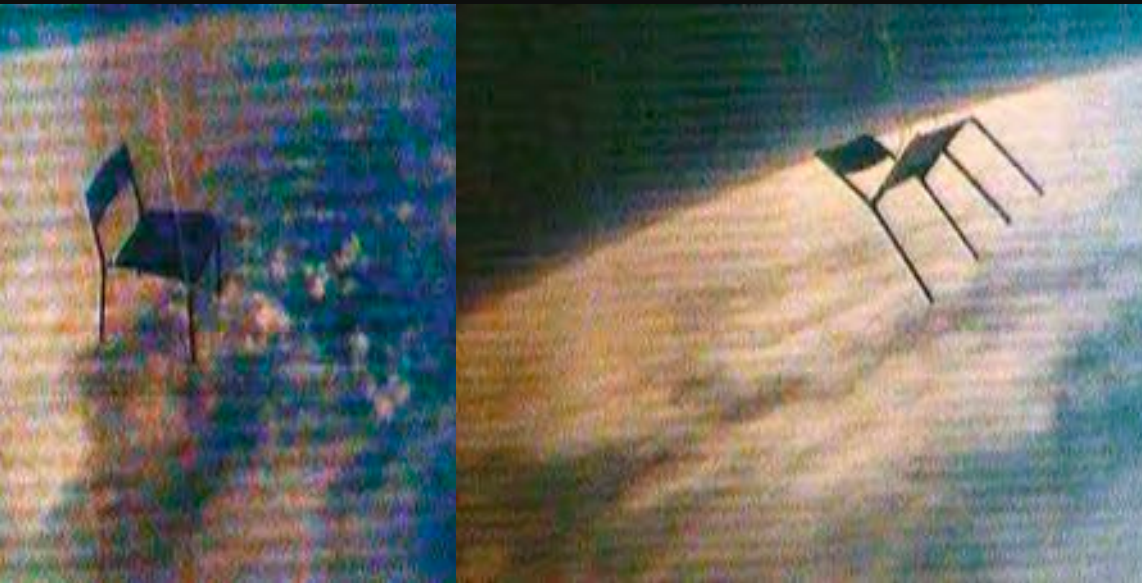
P. 49 : Simon Faithfull , Space Car Proposal , 2001. Dessin numérique d'un projet non réalisé. © de l'artiste.

la planète, 30 km ce n'est rien – une fine ligne de gaz bleue dans laquelle nous passons toute notre vie en croyant que c'est l'Univers. 6 » L'œuvre permet l'avènement d'un nouvel espace 7 , qui réunit ce que la perception sépare. Sans doute, Faithfull nourrit-il l'espoir d'atteindre une impossible « image haptique » où réalité et représentation fusionneraient en un mouvement de liberté et d'appropriation.