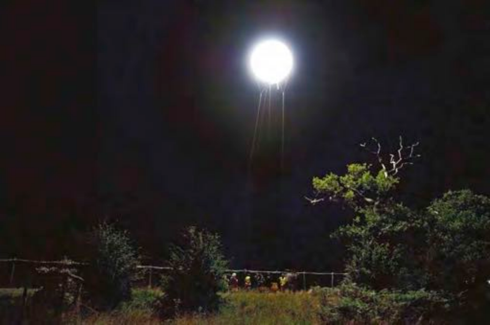
Simon Faithfull , Fake Moon , 2008. Installation lumineuse créée pour le Big Chill Festival. © de l'artiste