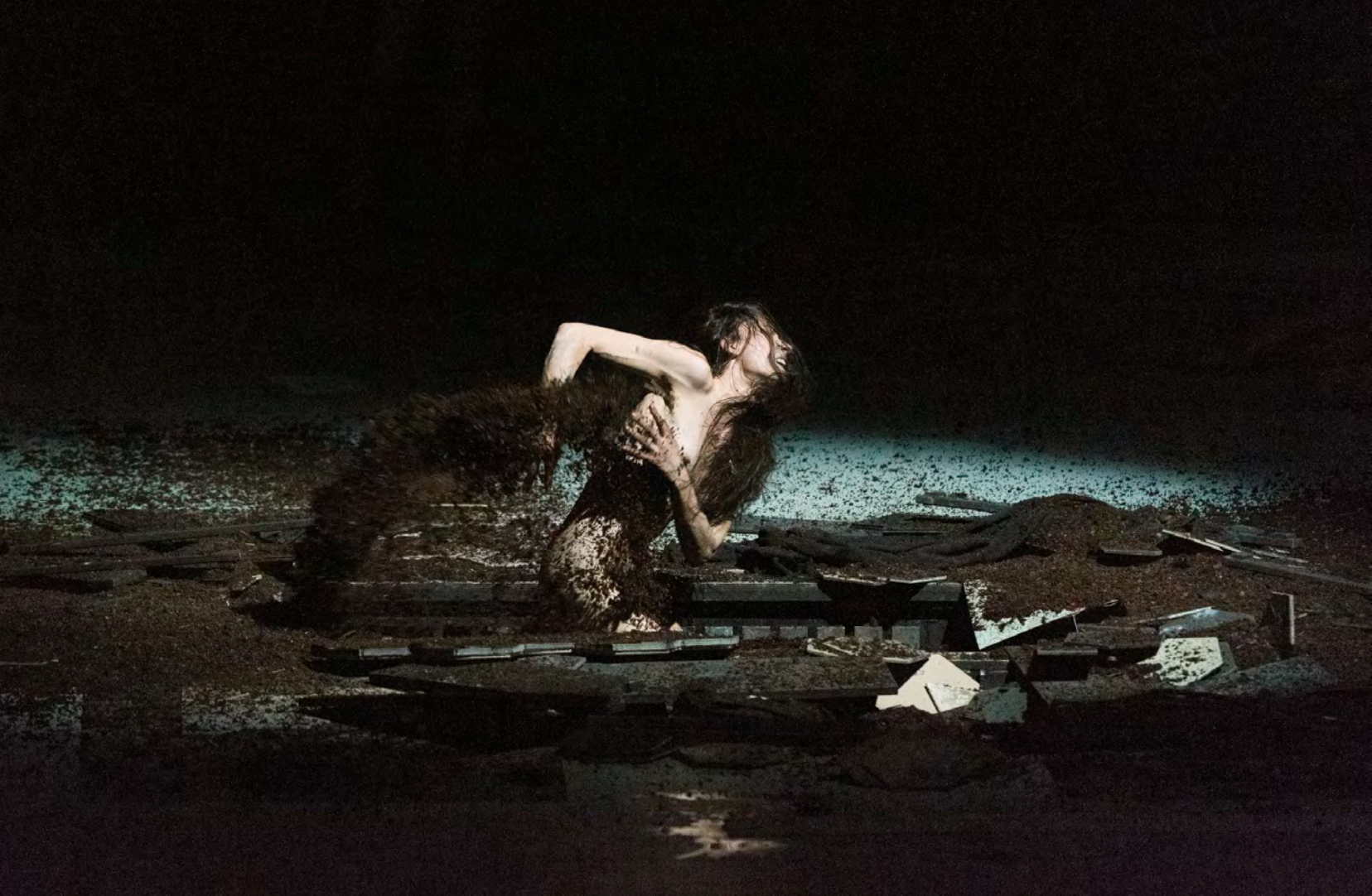
Romeo Castellucci, Jeanne au bûcher , 2017.

to bring about the conditions of truly tragic situations. Furthermore, all his plays respect the blueprint of tragedy with its progression towards a culminating moment, the climax, which precipitates the resolution of the dilemma. Each play thus moves towards the crucial moment of a barely tolerable intensity that leads to the death of the hero, the destruction of the theatre set and the furious build-up of music.