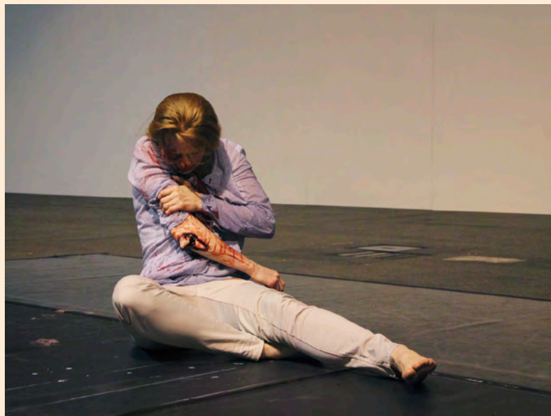
Romeo Castellucci, El Metope del Partenon , 2015. P. 54-55 : Romeo Castellucci, Moses und Aron , 2015. P. 58-59 : Romeo Castellucci, Le sacre du printemps , 2014.

Si l'œuvre de Castellucci se prête particulièrement aux frissons, c'est qu'elle met en jeu tous les procédés esthétiques qui les conditionnent : un dispositif immersif sollicitant une attention globale, l'inscription dans une durée, un lien fort à la musique. Si sa forme est bien scénique, le travail de ce diplômé des beaux-arts de Bologne ne peut néanmoins pleinement s'inscrire dans un genre explicitement théâtral, aussi emprunte-t-il ses codes à la sculpture minimale, au process art , à la peinture ou encore au cinéma. Le texte y est peu présent et le jeu d'acteur est mis en concurrence avec une scénographie à la plasticité ciselée,