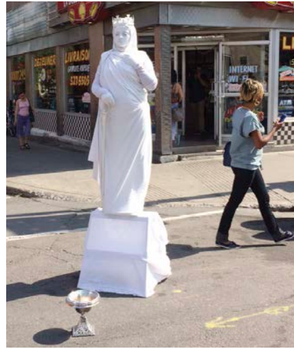
Photographie prise sur l'avenue Mont-Royal, septembre 2015.

The Soft Power performers intervene in busy places, at sites that are worth visiting. They revisit the popular culture associated with these tourist attractions, which consists of souvenirs whereby people appropriate the monuments and conserve a trace of them. Notably, the performers particularly take up this culture's performative manifestations. They react to these games that are played by tourists or public entertainers to engage with or to embody the monument.