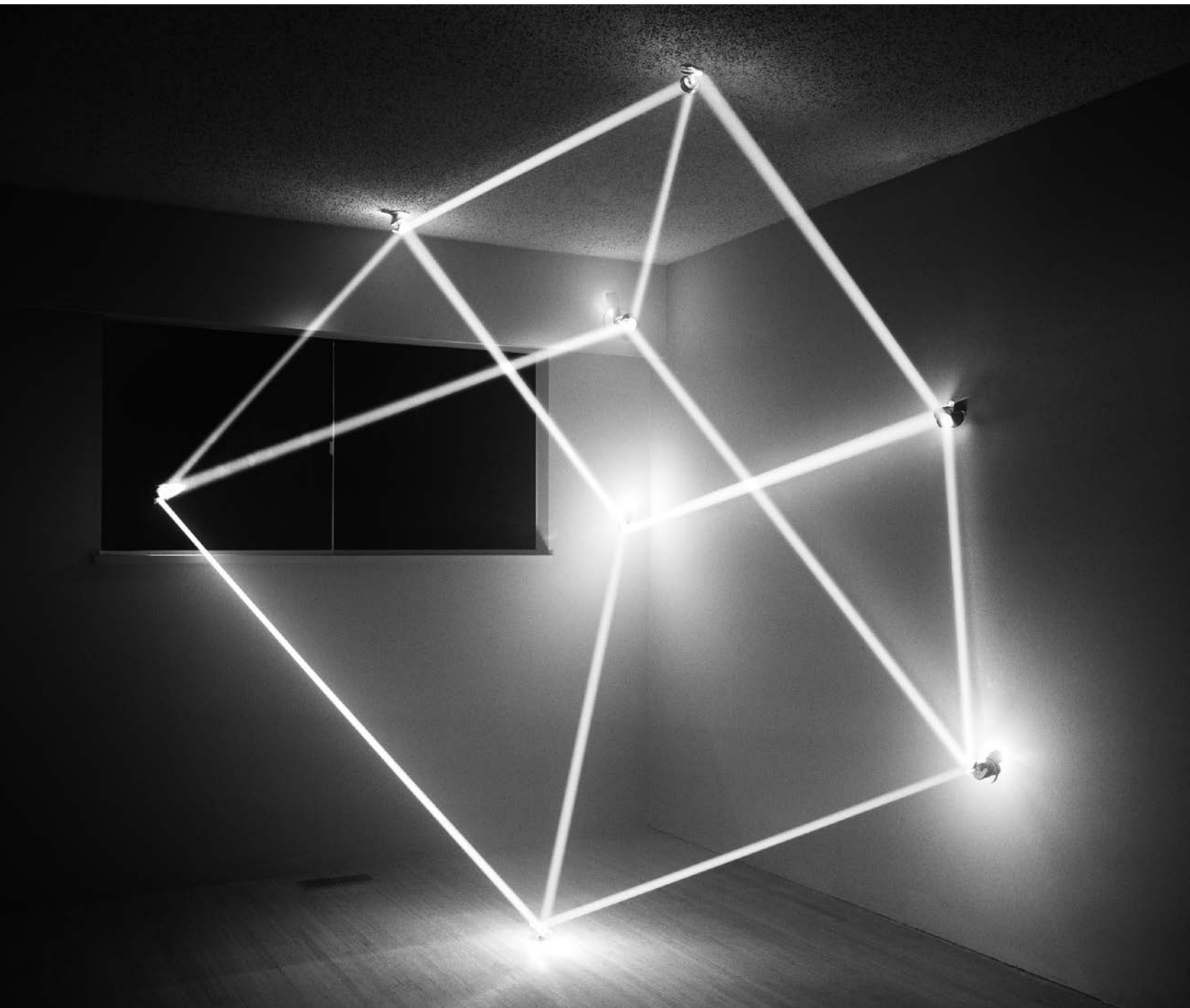
James Nizam , Umbra , 2013.