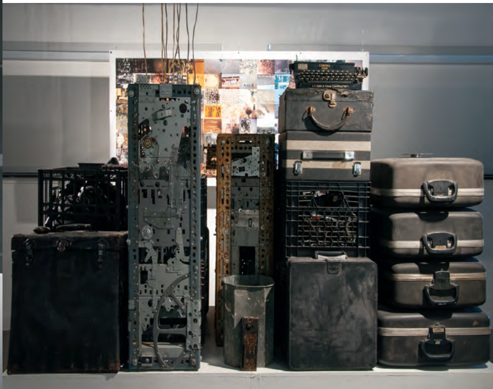
Laurent GAGNON, Univers plein , 2013. Vues partielles.