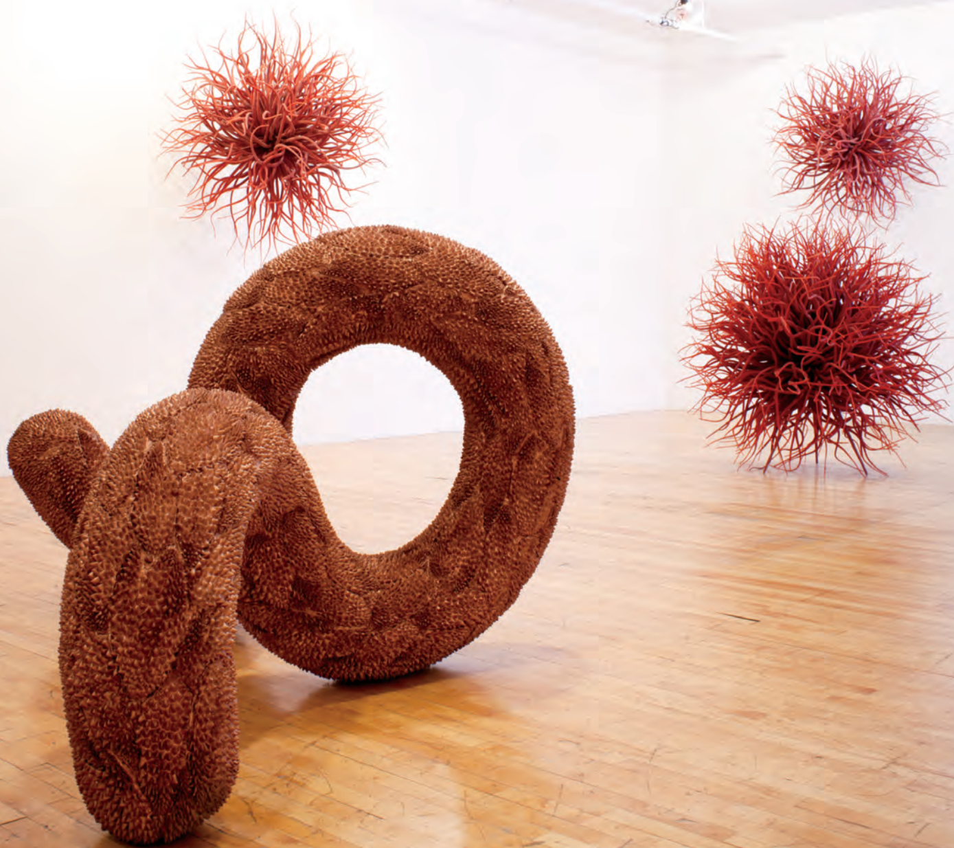
Denis ROUSSEAU, Gorganciel , 2013. Vue d'ensemble ( Les Gorgones et Le cuirassé de Spire ). Galerie Joyce Yahouda.