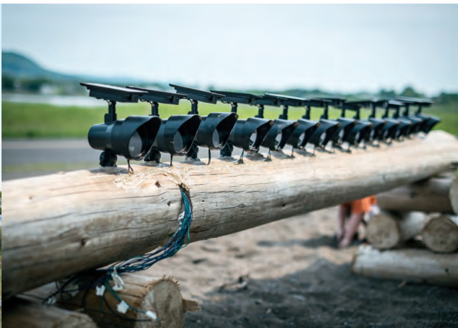
Jean-François CAISSY, La bête au village , 2013.