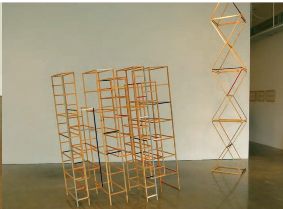
Josée DUBEAU, Light Distance , 2012. Pin. Bibliothèque : 170 x 81 x 158 cm ; colonne : 320 x 46 x 46 cm. Patrick Mikhail Gallery, Ottawa.