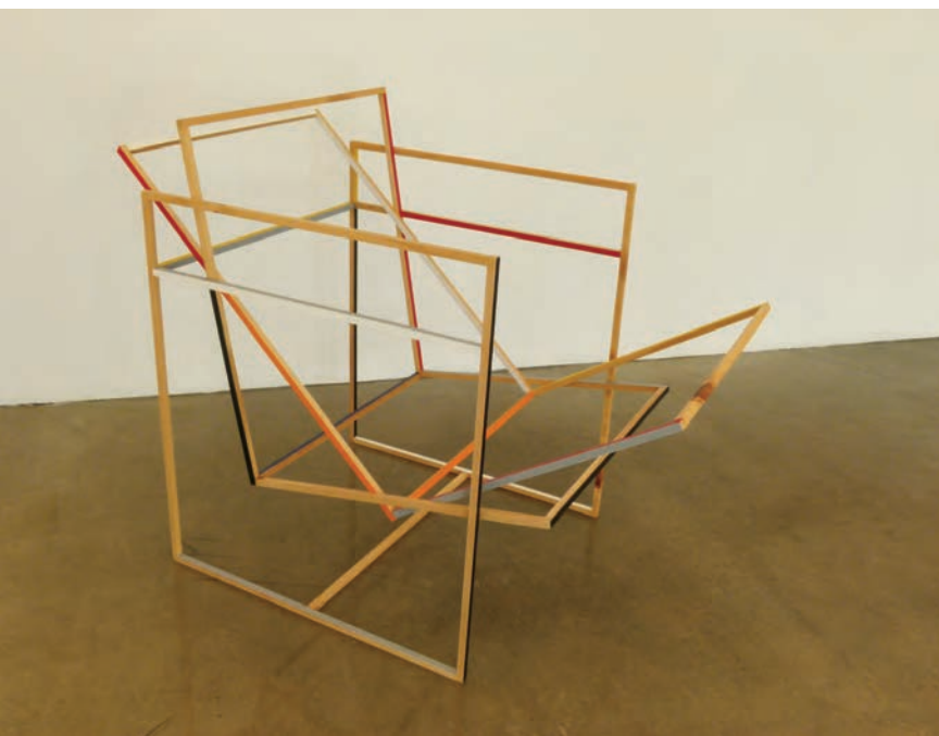
Josée DUBEAU, Light Distance , 2012. Pin. Chaise : 84 x 60 x 102 cm. Patrick Mikhail Gallery, Ottawa.

Qu'est-ce donc qu'une règle à calcul ? Deux systèmes de chiffres et de graduations combinés avec une ingéniosité inouïe ; deux petits bâtons laqués de blanc