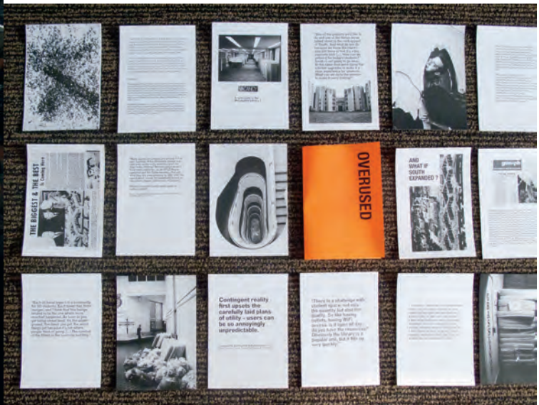
SYN- atelier d'exploration urbaine, Infra-campus , 2011. Guelph, Ontario.